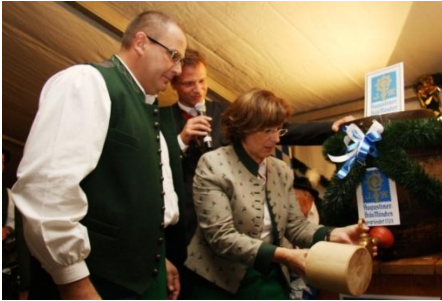
Gekonnt zapft Europaministerin Emilia Müller das Fass an.

Mit nur zwei Schlägen hat die Bayerische Europaministerin Emilia Müller am Abend des 13. Oktober 2009 das 11. Oktoberfest in Brüssel eröffnet. 2.000 Ehrengäste aus den Europäischen Institutionen, den diplomatischen Vertretungen, der NATO, den Regionen Europas und den Brüsseler Interessenvertretungen, unter ihnen hohe Brüsseler Politik-Prominenz, bewunderten im weiß-blau geschmückten Festzelt auf dem Place Jourdan das gekonnte Anzapfen der Ministerin.