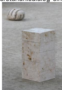
Kalksteinskulpturen schmücken den Hof der Bayerischen Vertretung