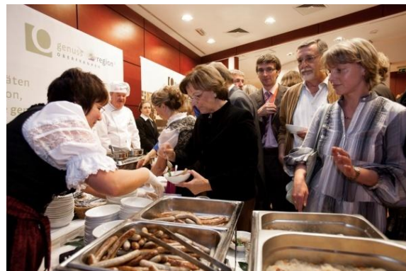
Staatsministerin Emilia Müller überzeugt sich persönlich von den kulinarischen Vorzügen der „Genussregion Oberfranken“