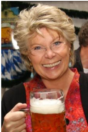
Medienkommissarin Viviane Reding testet das bayerische Bier

(Fortsetzung von S. 1) Die Europaministerin sagte, ein Grund hierfür könnte die Devise der Bayern, „Leben und leben lassen“, sein. Jeder sei auf dem Oktoberfest willkommen, jeder werde mit der gleichen Offenheit aufgenommen und mit der gleichen Gastfreundschaft behandelt. Dass dadurch viele Menschen angezogen würden, sei richtig so, denn das Oktoberfest sei von Anfang an ein „Volksfest“ – ein Fest für das Volk gewesen. „Wir freuen uns natürlich umso mehr, wenn die ‚liberalitas Bavariae‘ auch bei anderen Völkern geschätzt wird und als nachahmenswert gilt“, erklärte Emilia Müller.