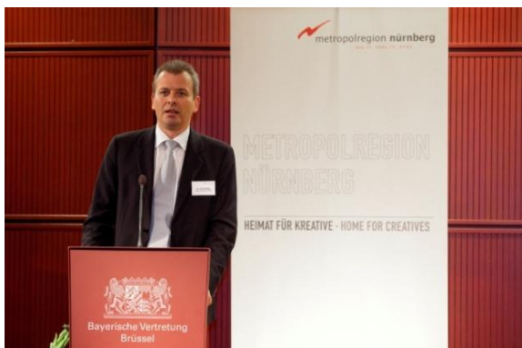
OB Dr. Ulrich Maly, Leiter der deutschen Delegation beim Ausschuss der Regionen und Ratsvorsitzender der Europäischen Metropolregion Nürnberg

Dem Abendempfang waren mehrere Workshops im Rahmen der Open Days vorausgegangen, zu denen die Metropolregion Nürnberg mit Vertretern weiterer Metropolregionen aus dem Zusammenschluss METREX eingeladen hatte. Die Vertreter der Regionen tauschten auf europäischer Ebene Erfahrungen zu den Themen Energiesysteme, Verkehr und Kohäsion in den verschiedenen Metropolregionen aus. Die Open Days der Städte und Regionen, die vom 5. bis zum 8. Oktober 2009 in Brüssel stattfanden, werden jedes Jahr gemeinsam vom Ausschuss der Regionen und der Generaldirektion der Regionalpolitik der EU-Kommission veranstaltet. Bei 125 Veranstaltungen wie Workshops und Diskussionsforen präsentierten sich 213 Regionen.