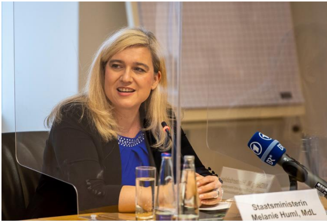
Staatsministerin Melanie Huml, MdL