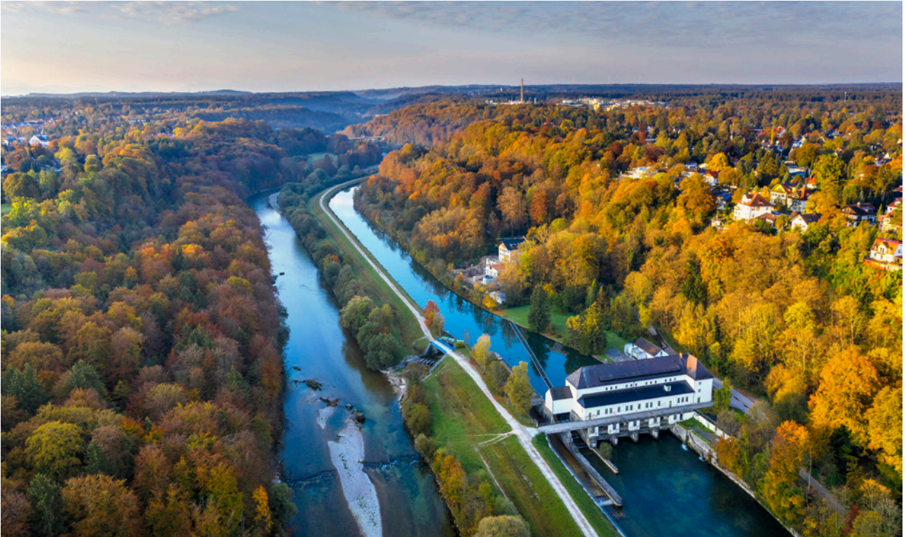
Wasserkraftwerk Pullach, Isar und Isarkanal