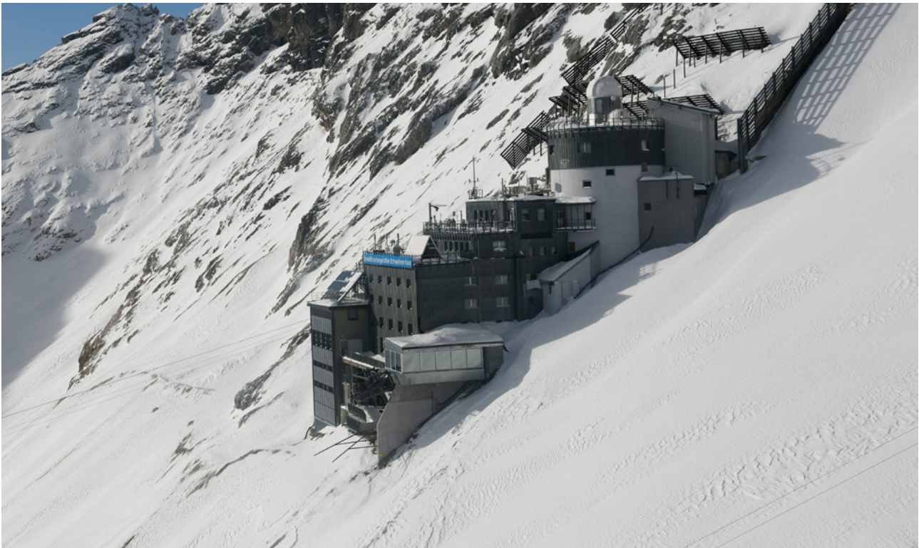
Umweltforschungsstation Schneefernerhaus auf der Zugspitze