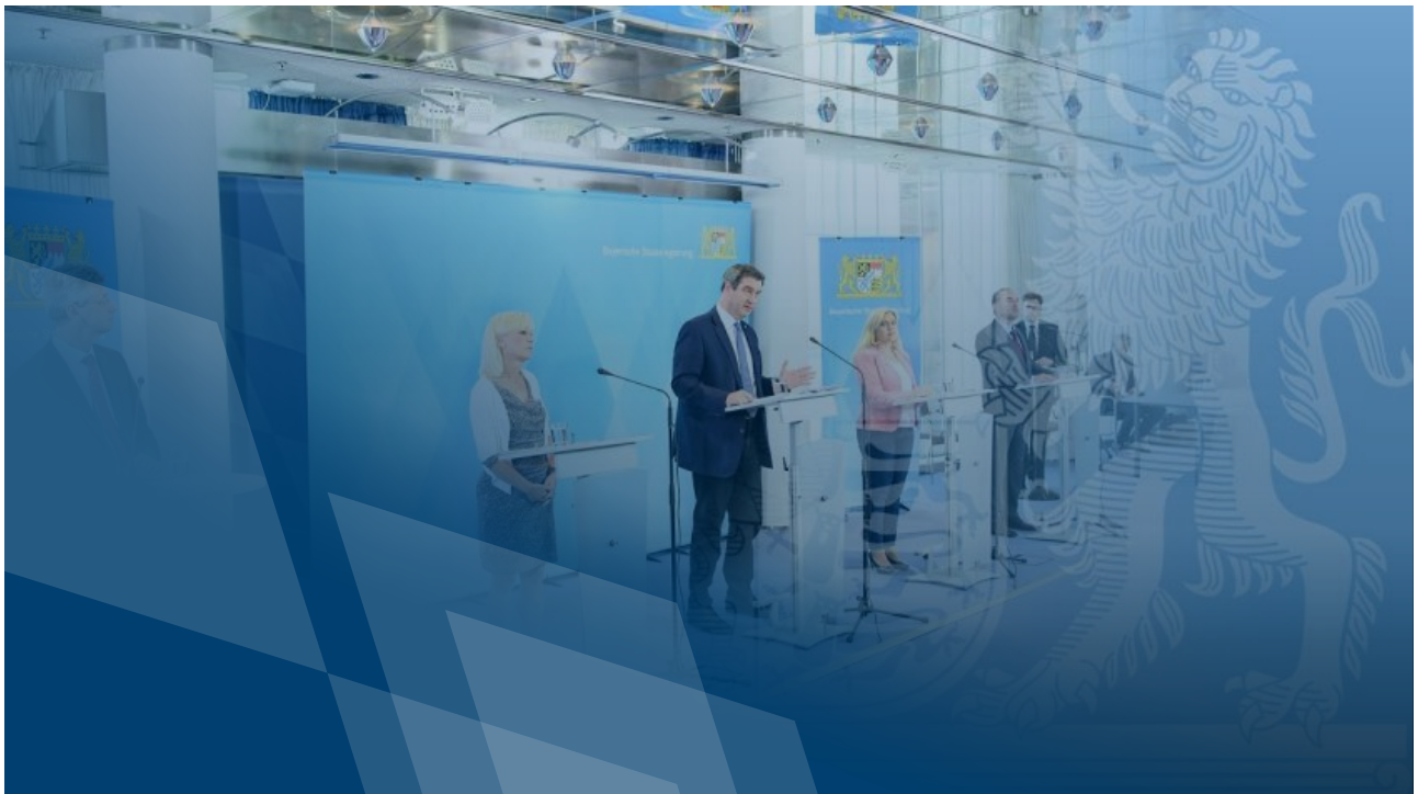
Fortsetzung der bayerischen Corona-Strategie (16. April 2020)