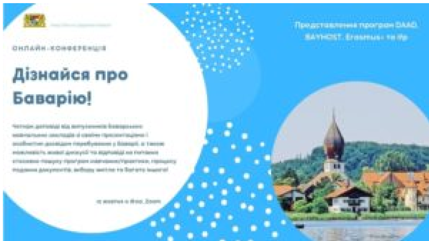
Konferenz „Erlebe Bayern“ – Bayern

12 жовтня 2021 року у рамках «Тижнів Німеччини» Бюро Вільної держави Баварія в Україні організувало онлайн-конференцію «Дізнайся про Баварію».