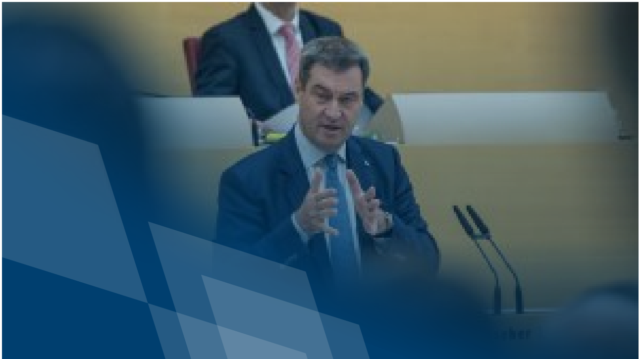
Regierungserklärung "Hightech Agenda Bayern" (Auszüge)