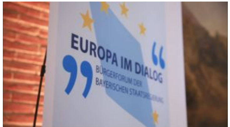
Bürgerforum „Europa im Dialog“ – Bayern