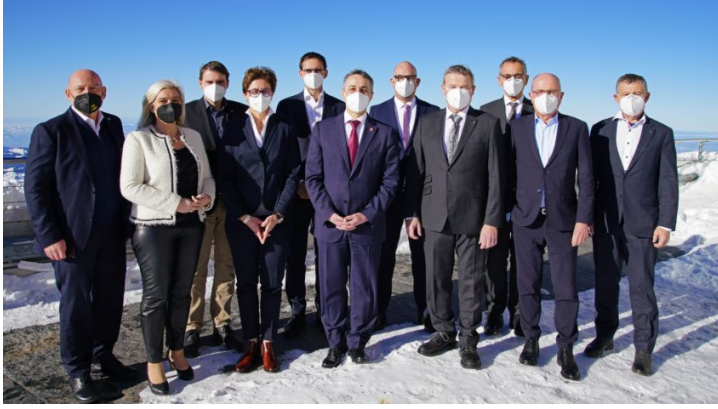
50 Jahre Internationale Bodensee-Konferenz