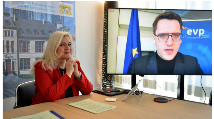
Europäischer Green Deal: CO2-Bepreisung – was wird aus ...