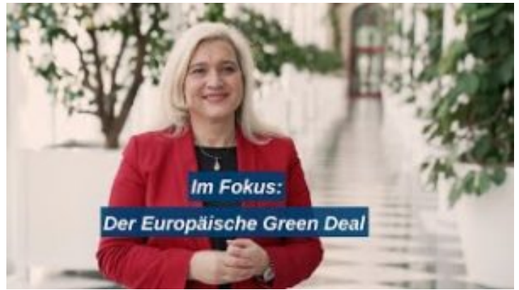
Im Fokus: Der Europäische Green Deal – Bayern