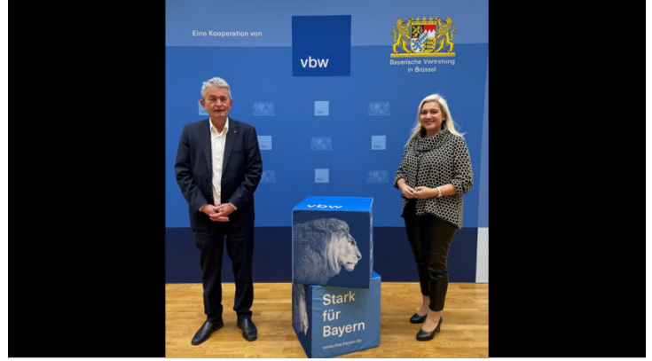
Austausch zu wichtigen politischen Themen im Jahr 2022