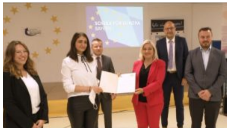
Verleihung der Europa-Urkunde 2021 – Bayern