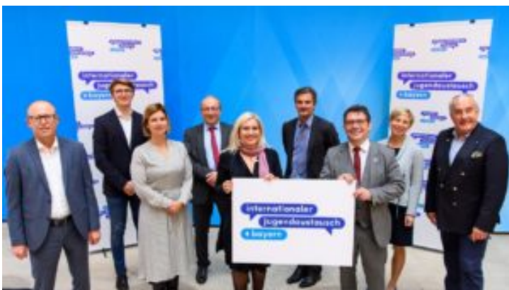
Kuratoriumssitzung der Stiftung „Jugendaustausch Bayern“ ...