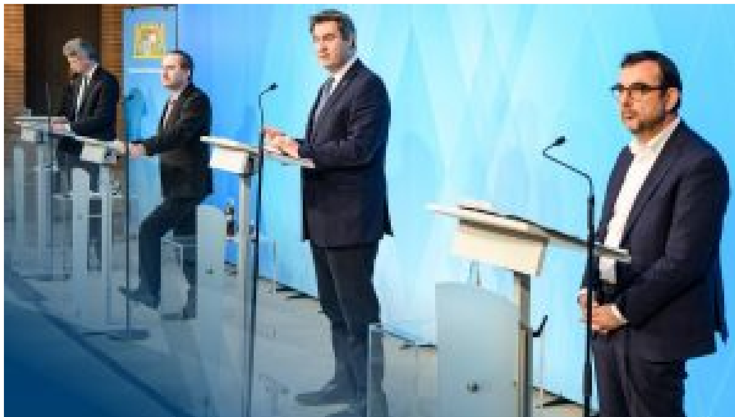
Pressekonferenz zur Corona-Pandemie (11. Februar 2021)