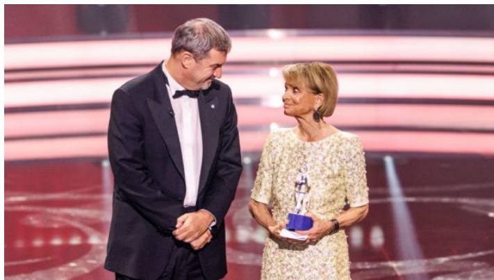
46. Bayerischer Filmpreis