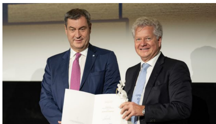
Bayerischer Printpreis 2023