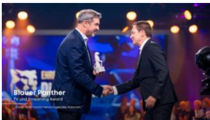
Blauer Panther 2024 - Bayern