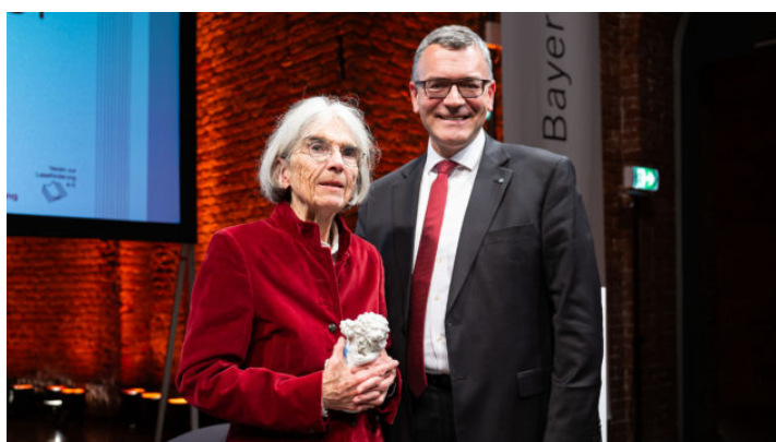
Bayerischer Buchpreis 2024