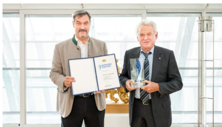
Bayerischer Sportpreis 2024 in der Kategorie „Persönlicher ...“