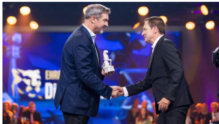
Blauer Panther - TV & Streaming Award 2024