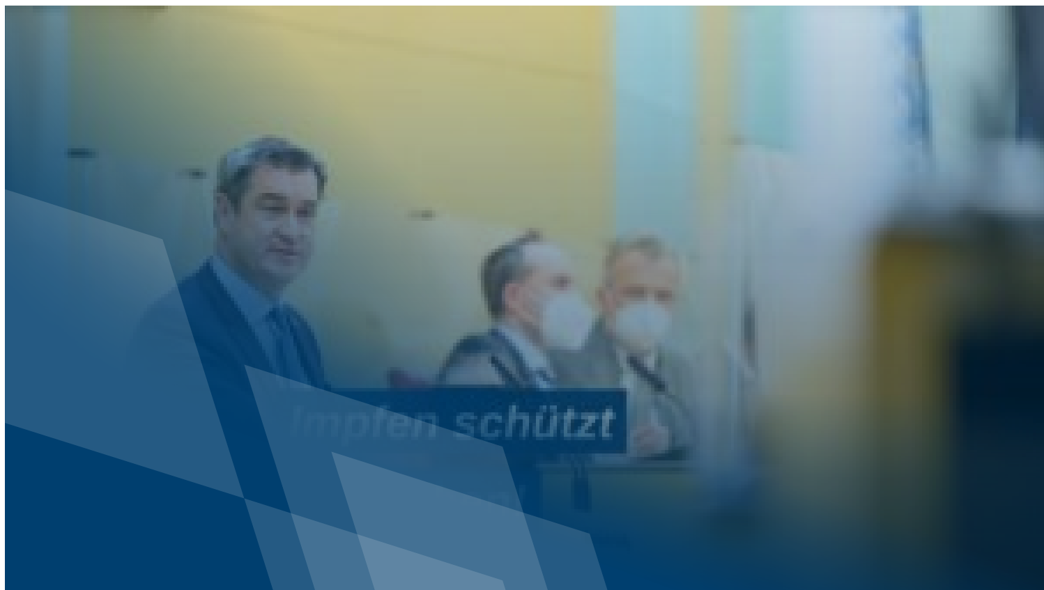
13. Regierungserklärung zur Corona-Pandemie