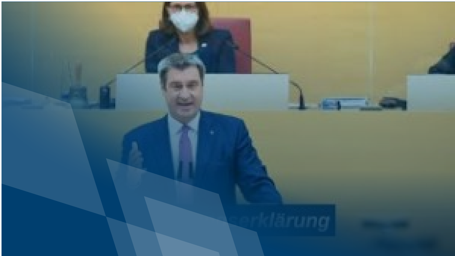
Regierungserklärung von Ministerpräsident Dr. Markus Söder zu Ukraine-Krieg und Corona-Pandemie