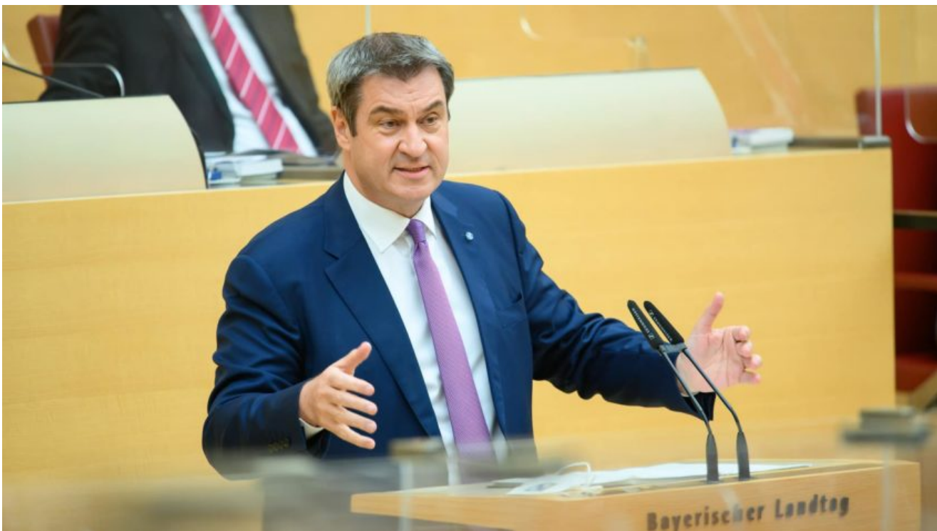
Regierungserklärung von Ministerpräsident Dr. Markus Söder, MdL.

Abgeordneten sagen zu können: Auch wir unterstützen die Bundesregierung. Wir fordern einen sofortigen Waffenstillstand, das Ende der Angriffe, das Ende des Schießens auf Zivilisten, die Anerkennung des Rechts, und zwar nicht irgendwann, sondern jetzt, am heutigen Tag!