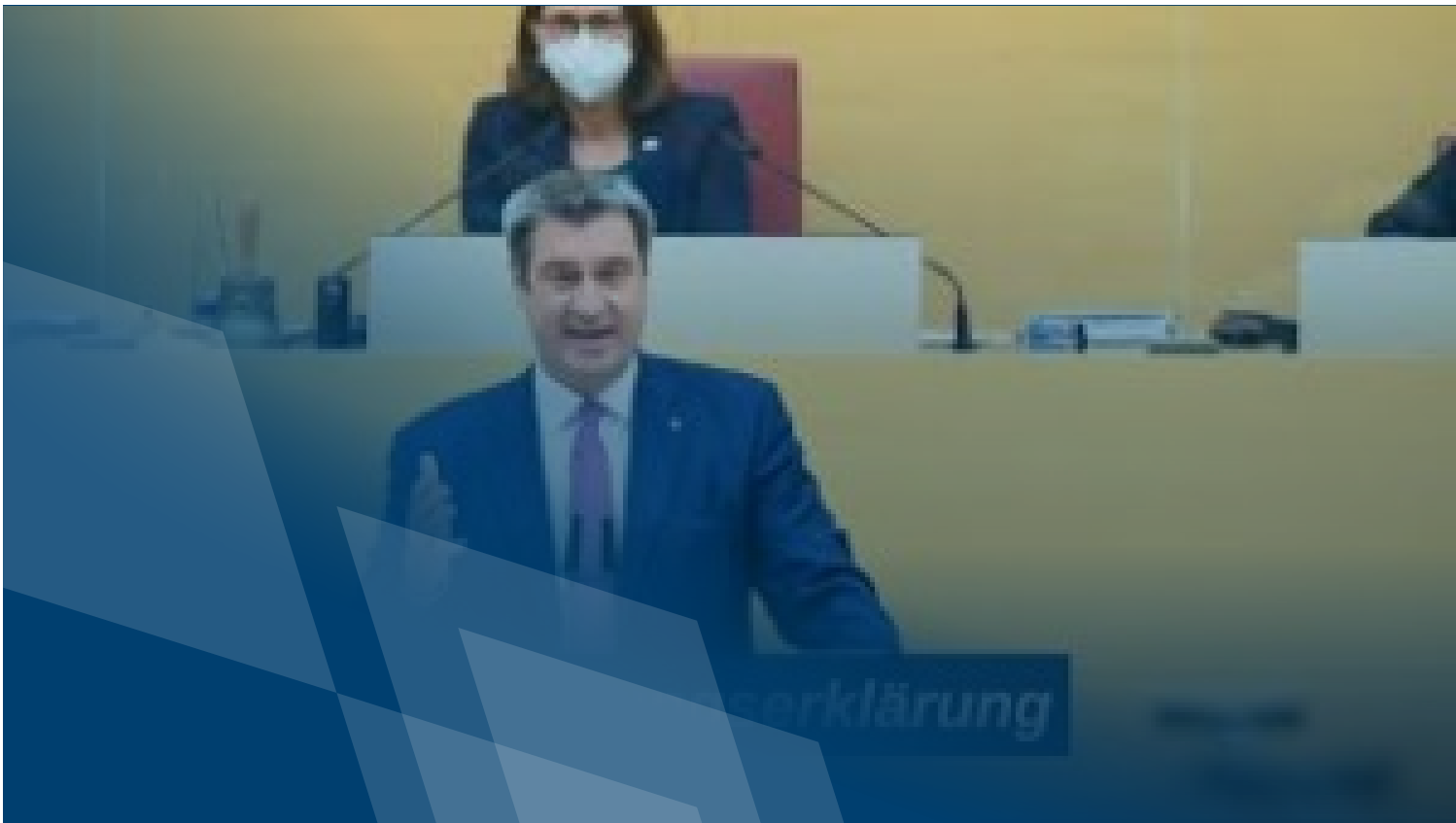
Regierungserklärung von Ministerpräsident Dr. Markus Söder zu Ukraine-Krieg und Corona-Pandemie