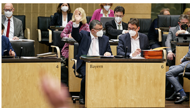
Staatsminister Dr. Florian Herrmann und Justizminister Georg Eisenreich

Aus bayerischer Sicht abzulehnen sind die von der Bundesregierung auf den Weg gebrachten Neuregelungen der Sanktionen in der Grundsicherung für Arbeitssuchende . Mit einem sog. Sanktionsmoratorium sollen künftig bei Verstoß gegen Hartz-IV-Mitwirkungspflichten (z. B. bei Nichtannahme einer vermittelten