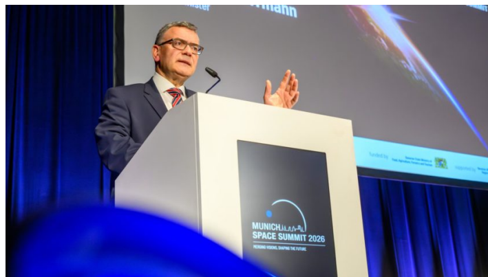
Munich Space Summit 2026