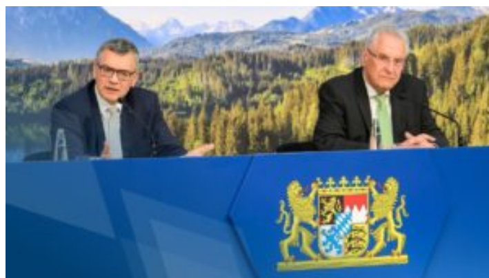
Pressekonferenz nach der Kabinettsitzung (24.03.2026) - ...