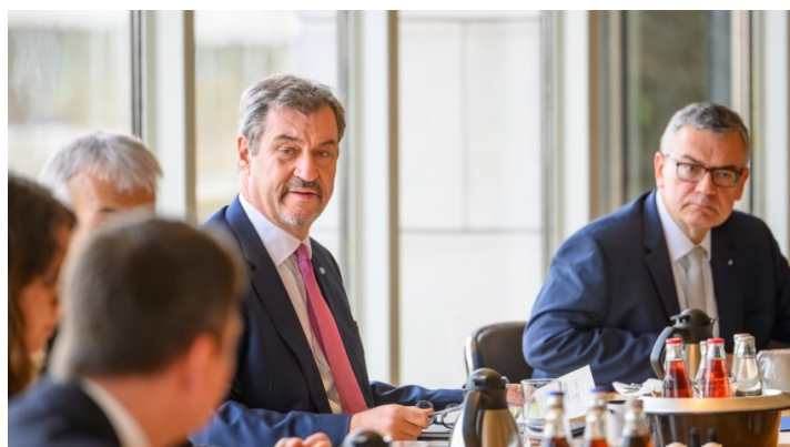
Kabinettsitzung am 24. März 2026