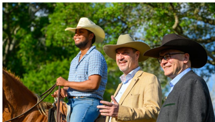
Reise nach Texas und South Carolina