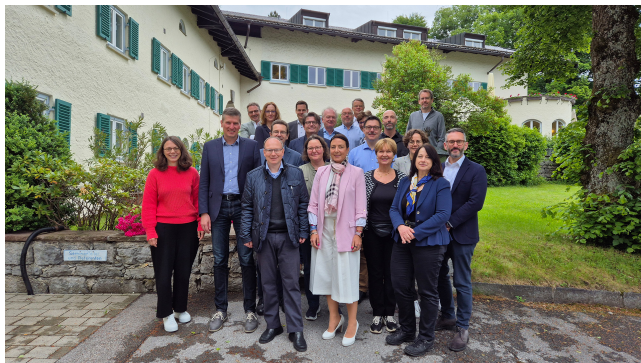
Participants au Programme Digital Governance (Gouvernance numérique)

Le programme Digital Governance (Gouvernance numérique) en cours d'emploi a été spécialement conçu pour les chefs de service adjoints des plus hautes autorités de service bavaroises. La série de séminaires en cours d'emploi prépare les participants à concevoir activement la transformation numérique de l'administration et à assumer des responsabilités de direction. En même temps, le programme sert à créer un réseau au sein de l'administration bavaroise et à établir des contacts professionnels au-delà des frontières du Land.