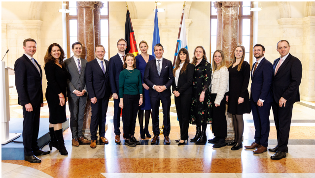
Participants au VIIe Programme Excellence Europe

La formation continue « Excellence EUROPA » permet aux cadres de la fonction publique de devenir des experts en connaissances européennes et d'être polyvalents. L'intensité d'apprentissage leur permet d'améliorer leurs compétences linguistiques mais aussi d'élargir leurs connaissances spécifiques.