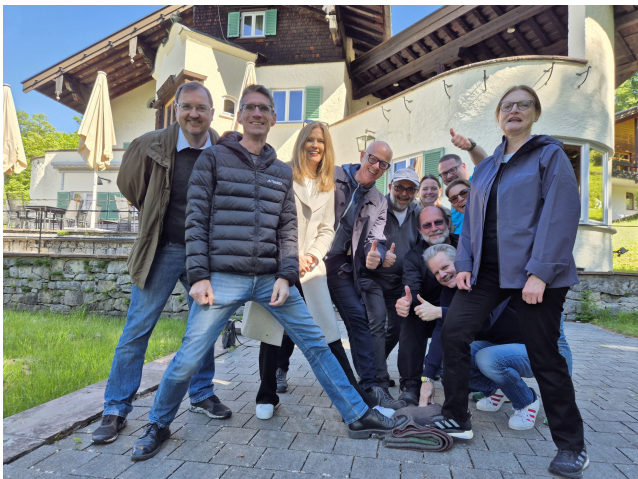
Participants du programme TOP Management.