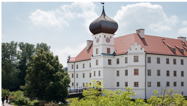
Schloss Hohenkammer

Le séminaire international est organisé tous les deux ans par la Chancellerie de l'État de Bavière en coopération avec le Consulat général des États-Unis d'Amérique et un autre pays invité. Il présente des intervenants de renom et traite des sujets transfrontaliers d'actualité. L'objectif est de promouvoir les compétences internationales de l'administration ministérielle bavaroise. Pour cela, la langue de travail est l'anglais.