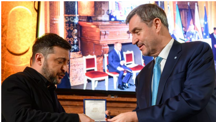
State Dinner anlässlich der MSC 2026