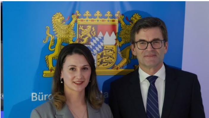
Weihnachtsempfang beim Büro des Freistaats Bayern in der Ukraine ...

Das Startsignal für das Bayerische Büro in Kyjiw wurde am 5. März 2018 gegeben.