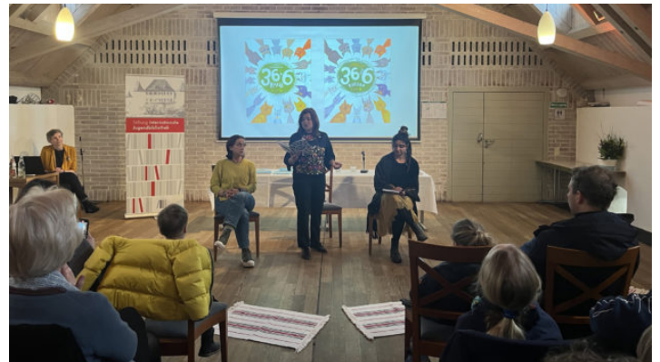
Abschlussveranstaltung des Kinderbuchsprojektes in der Internationalen ...