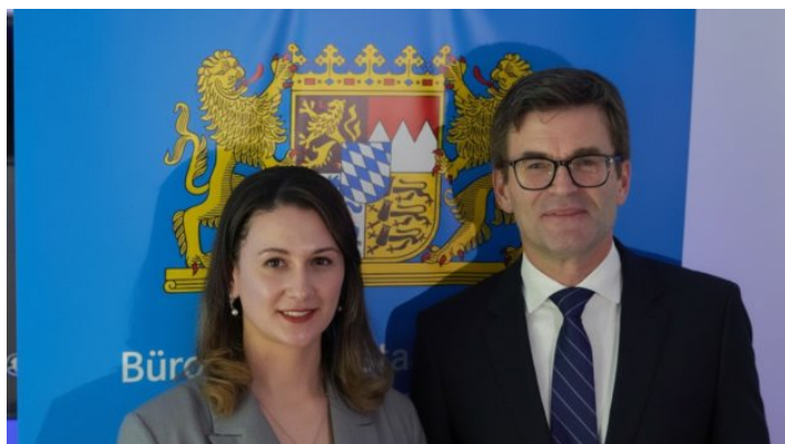
Weihnachtsempfang beim Büro des Freistaats Bayern in der Ukraine ...

Das Startsignal für das Bayerische Büro in Kyjiw wurde am 5. März 2018 gegeben.