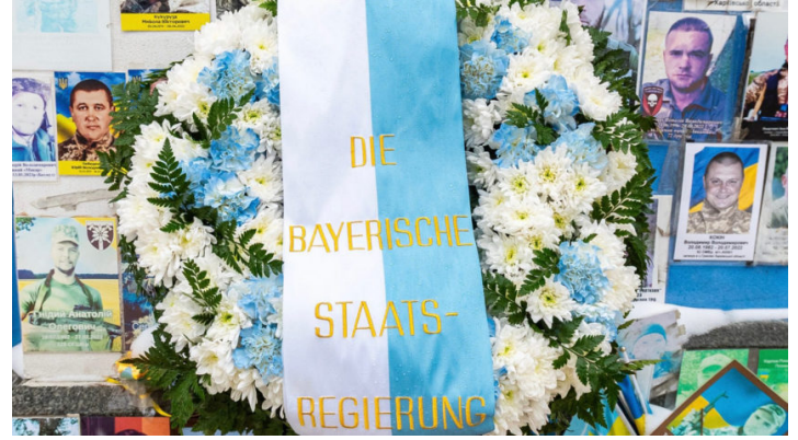
4. Jahrestag des russischen Angriffskrieges in der Ukraine