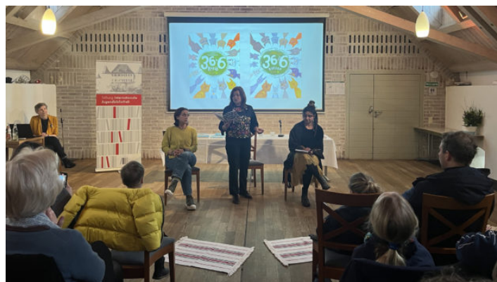
Abschlussveranstaltung des Kinderbuchsprojektes in der Internationalen ...