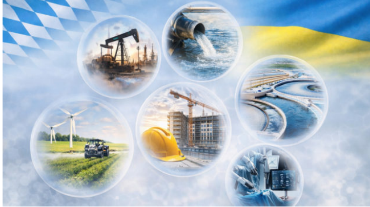
Віртуальний економічний форум