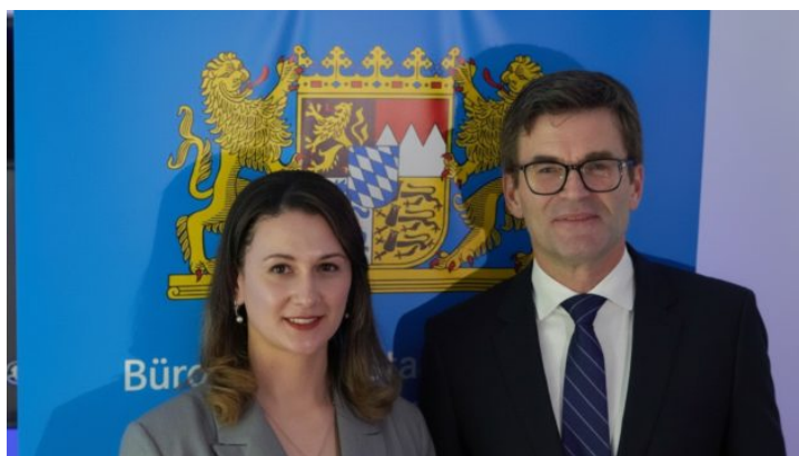
Різдвяний прийом в Бюро Вільної держави ...