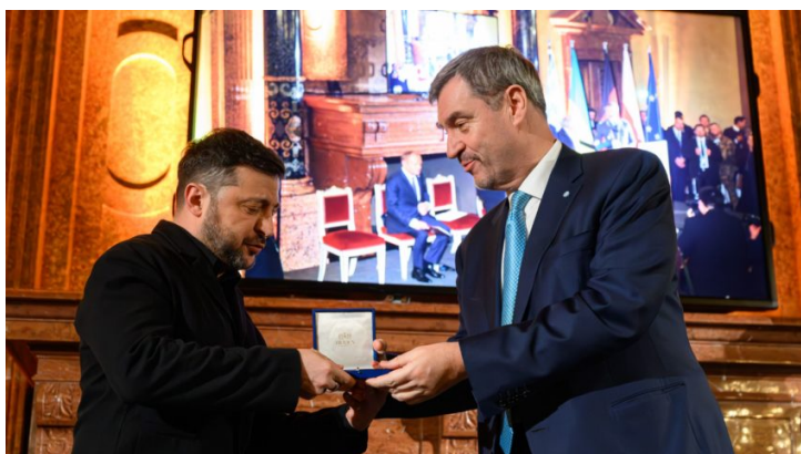
Вручення премії імені Евальда фон ...