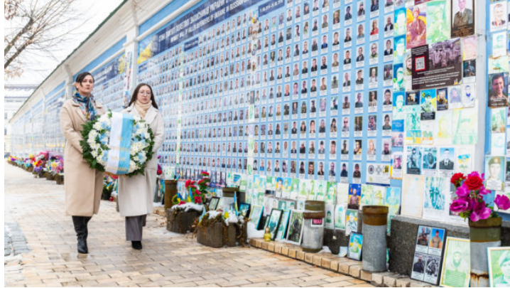
4-та річниця російського вторгнення ...