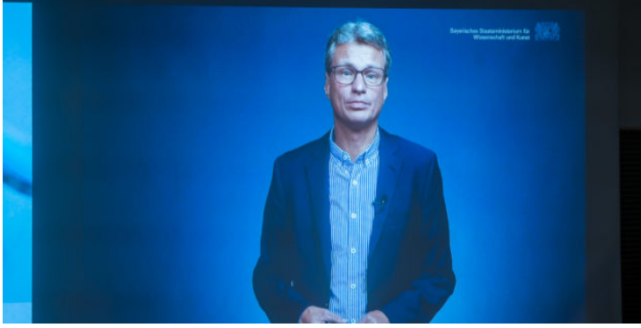
„Pathways into a Sustainable Future“: Konferenz zu grünen ...