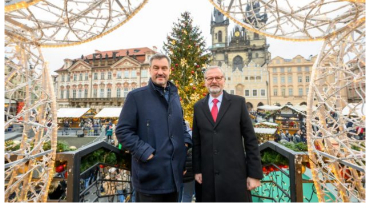
Ministerpräsident Dr. Söder in Prag