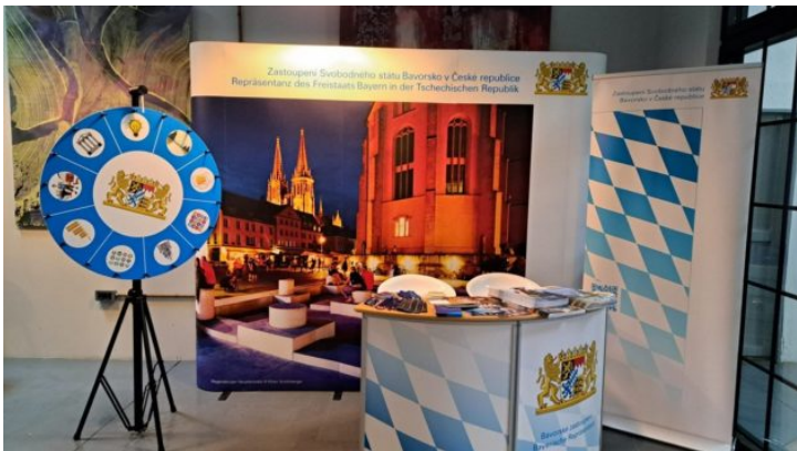
Treffpunkt-Festival in Pilsen