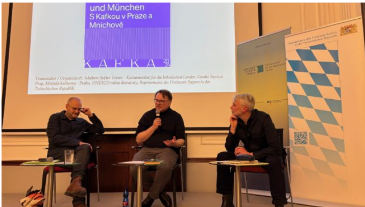
Mit Kafka in Prag und München