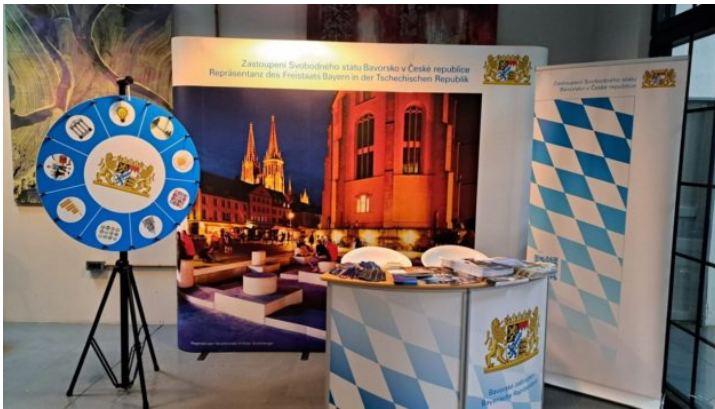
Treffpunkt-Festival in Pilsen