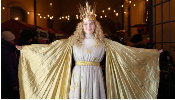
Glückliche Gesichter auf dem 2. Bayerisch-Böhmischen Adventsmarkt ...