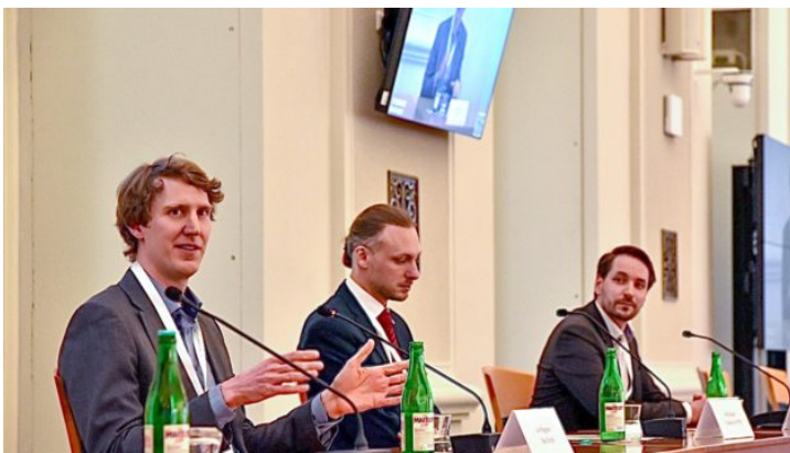
Deutsch-tschechischer Wasserstofftag in Prag