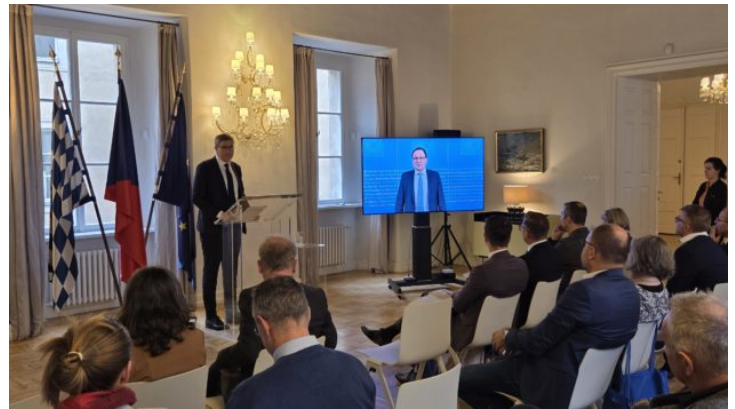
Fachtagung zur Stärkung des tschechischen Sprachunterrichts ...