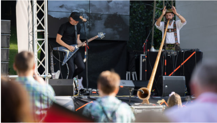
Bayern beim Tag der offenen Tür der Deutschen Botschaft in ...