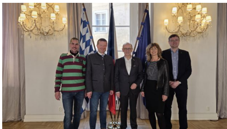
Auswahltagung für das Bayerische Parlamentspraktikum (BayPP) ...