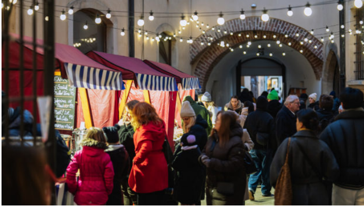
Adventsmarkt anlässlich 10 Jahre Bayerische Repräsentanz in ...

ubiläum 10 Jahre Repräsentanz des Freistaats Bayern in der Tschechischen Republik