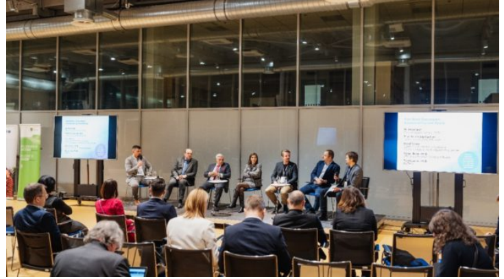
Netzwerktreffen „Sustainability and Space“ in Prag