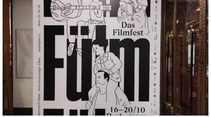
Festival deutschsprachiger Filme Das FILMFEST