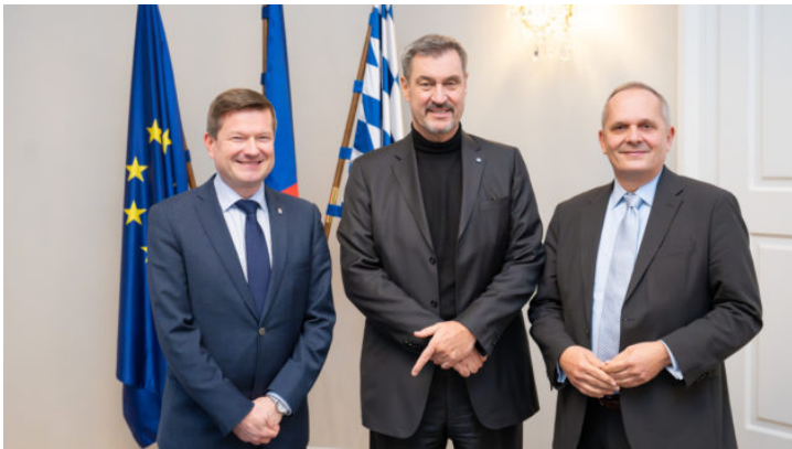
Besuch des Bayerischen Ministerpräsidenten in der Repräsentanz