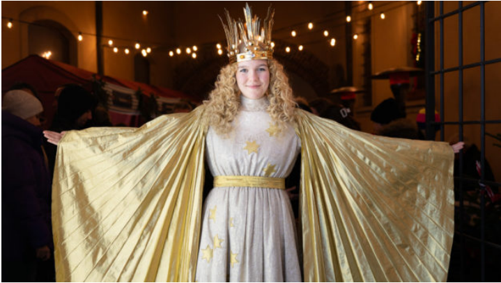
Glückliche Gesichter auf dem 2. Bayerisch-Böhmischen Adventsmarkt ...

Die Repräsentanz des Freistaats Bayern in der Tschechischen Republik intensiviert die Beziehungen Bayerns zur tschechischen Regierung, Zivilgesellschaft und Wirtschaft – über gemeinsame Projekte und Veranstaltungen und als Schaufenster Bayerns.