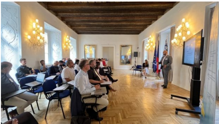
Bavarian-Czech AI and Robotics Workshop