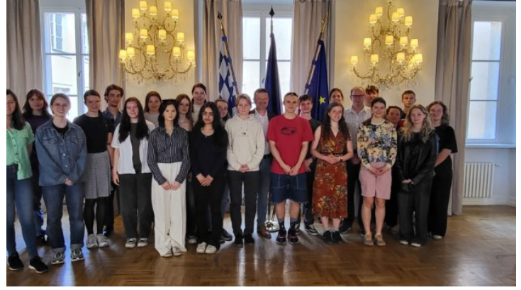
Bayerische und tschechische Schülerinnen und Schüler lernen ...