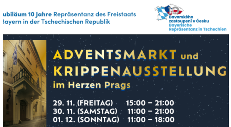
Adventsmarkt und Bayerisch-Böhmische Krippenausstellung