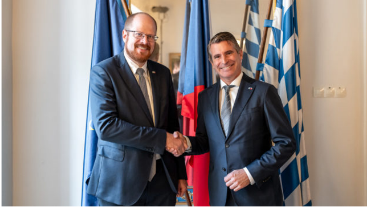
Festakt anlässlich 10 Jahre Bayerische Repräsentanz in Prag ...