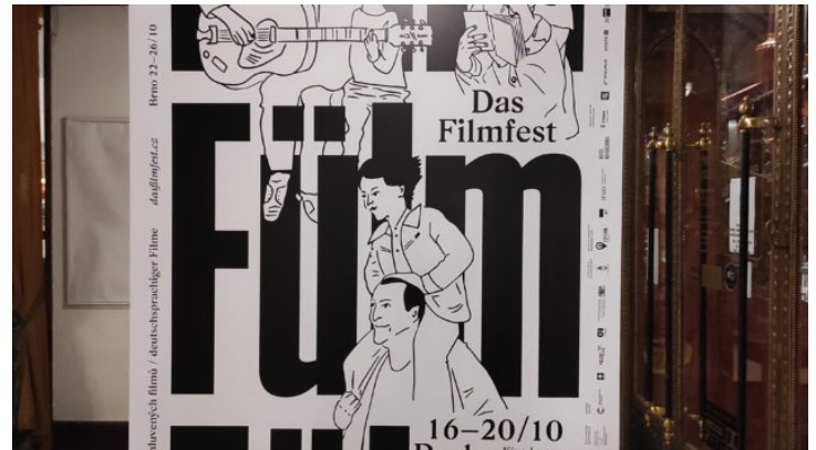
Festival deutschsprachiger Filme Das FILMFEST