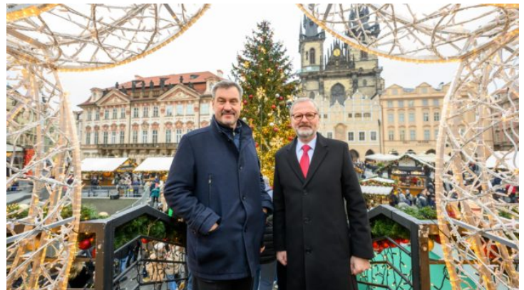
Ministerpräsident Dr. Söder in Prag