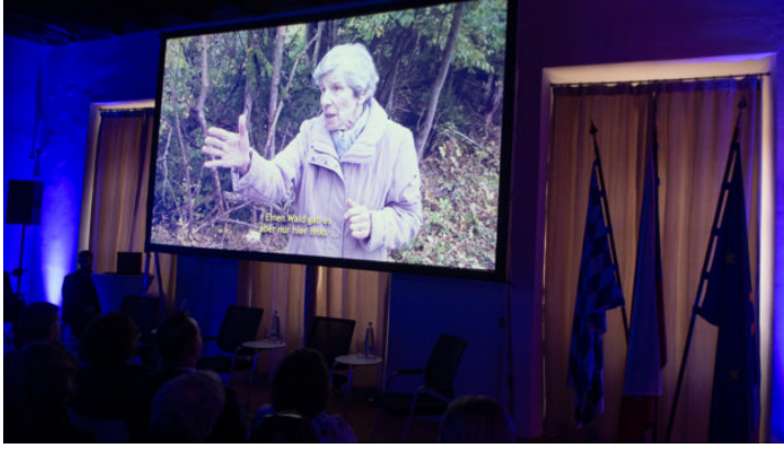
„Das Licht für die Zukunft / Světlo pro budoucnost“: Filmpremiere ...