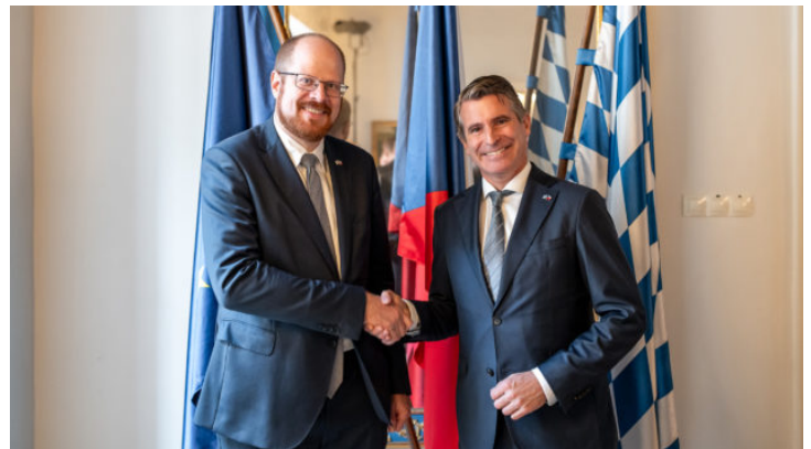
Festakt anlässlich 10 Jahre Bayerische Repräsentanz in Prag ...