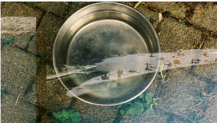
„Auf den zweiten Blick | Na druhý pohled“ Ein Fotoaustausch ...