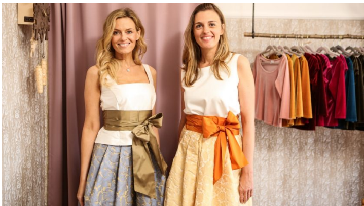
Und du so? Bayern und Tschechien im grenzenlosen Kultur-Austausch