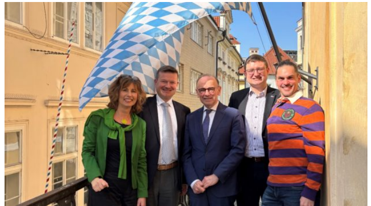
Auswahlgespräch für das Bayerische Parlamentspraktikum (BayPP) ...