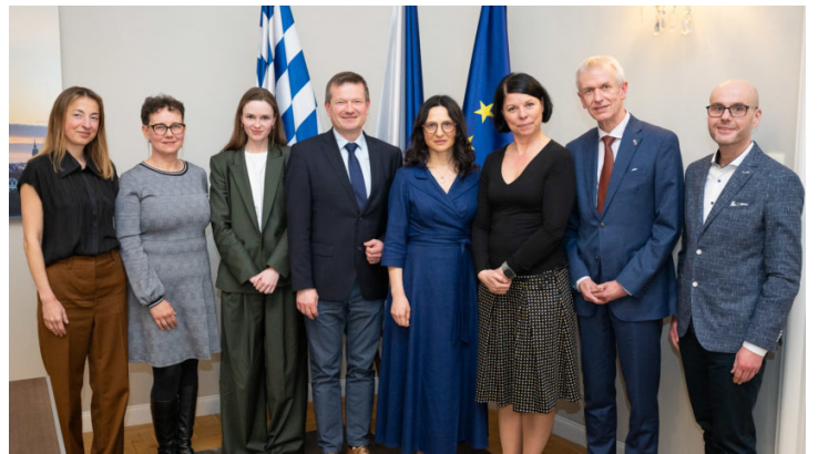
Podiumsdiskussion: Museumslandschaft zwischen öffentlicher ...