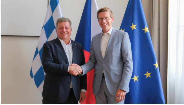
Bayerns und Tschechiens Verkehrsminister stellen Weichen für ...