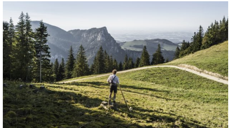
Vom Sofa nach Bayern: Alphornkonzert