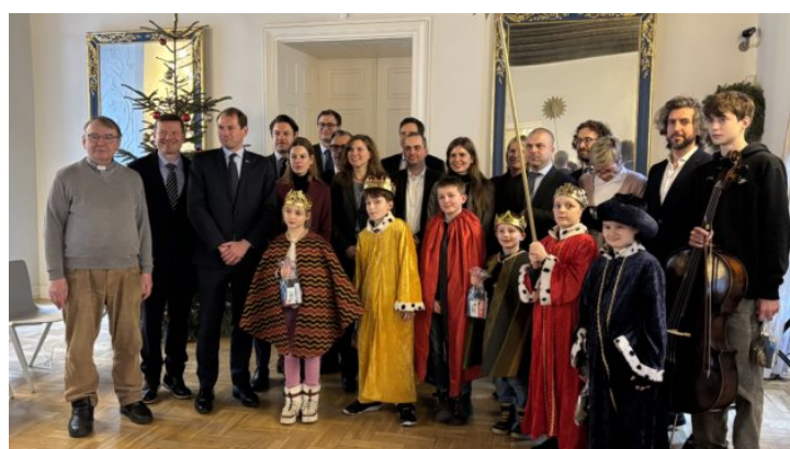
Sternsinger in der Repräsentanz