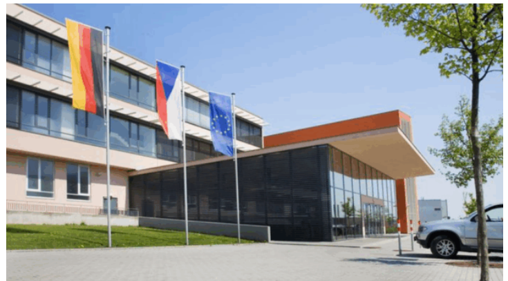
Zeitzeugengespräch an der Deutschen Schule Prag