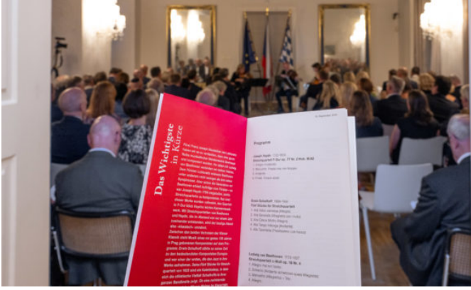
Konzert des Berganza-Quartetts der Bamberger Symphoniker in ...