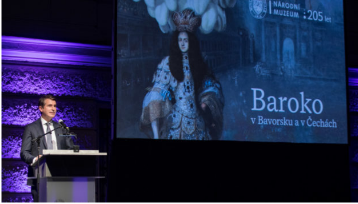
Eröffnung der bayerisch-tschechischen Landesausstellung in ...