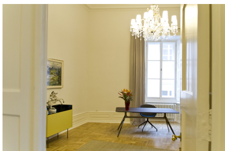
Räumlichkeiten der Bayerischen Repräsentanz in Prag.

Die Repräsentanz des Freistaats Bayern in Tschechien gewährt Besuchergruppen gerne Einblick in ihre Arbeit vor Ort.