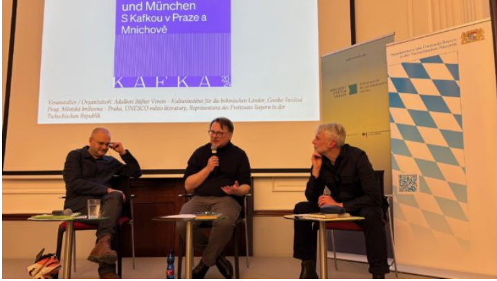
Mit Kafka in Prag und München