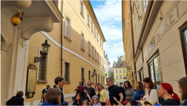
Bayern in Prag einmal anders

Die Repräsentanz des Freistaats Bayern in der Tschechischen Republik intensiviert die Beziehungen Bayerns zur tschechischen Regierung, Zivilgesellschaft und Wirtschaft – über gemeinsame Projekte und Veranstaltungen und als Schaufenster Bayerns.