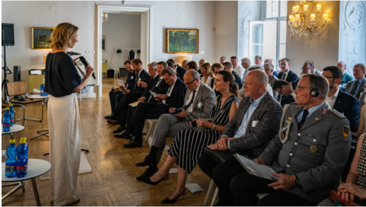
Fachkonferenz: „Europas Rüstungsindustrie im Wandel – Wettbewerbsfähigkeit, ...“

Die Repräsentanz des Freistaats Bayern in der Tschechischen Republik intensiviert die Beziehungen Bayerns zur tschechischen Regierung, Zivilgesellschaft und Wirtschaft – über gemeinsame Projekte und Veranstaltungen und als Schaufenster Bayerns.