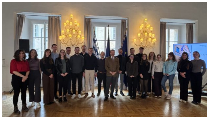
Besuch von Referendaren des Landgerichts Bamberg