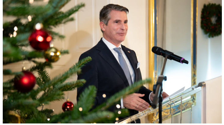
Abend im Advent 2025