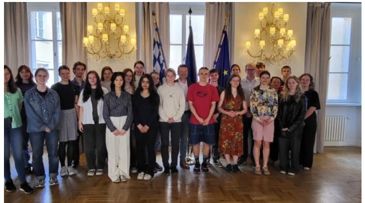
Bayerische und tschechische Schülerinnen und Schüler lernen ...