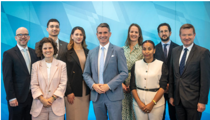
Die Leiterinnen und Leiter der Repräsentanzen des Freistaates ...