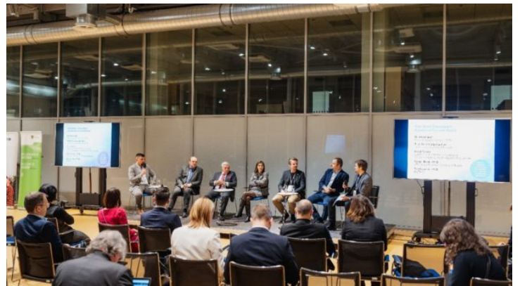
Netzwerktreffen „Sustainability and Space“ in Prag