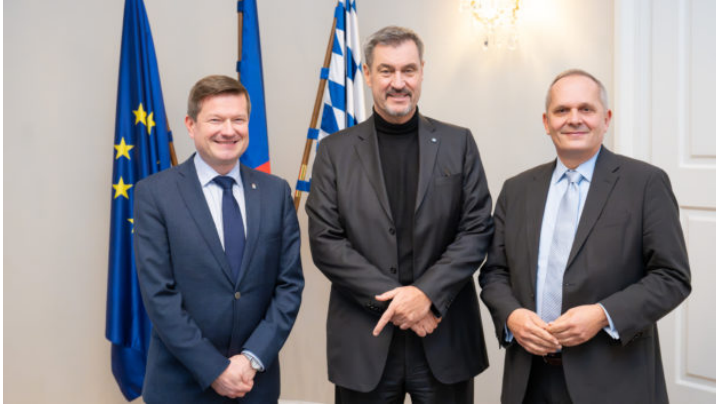
Besuch des Bayerischen Ministerpräsidenten in der Repräsentanz