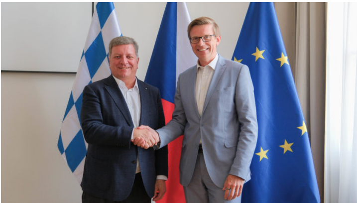
Bayerns und Tschechiens Verkehrsminister stellen Weichen für ...