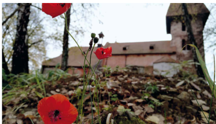
Ausstellung „Verblichen, aber nicht verschwunden“