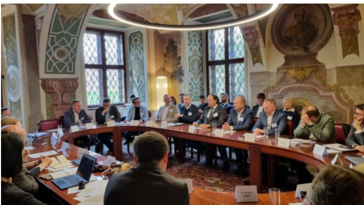
Grenzüberschreitender Dialog zum Thema „Artificial Intelligence ...