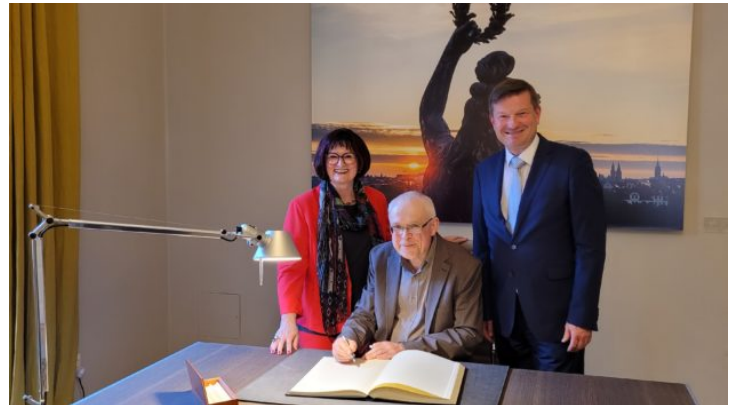
Vernissage der Ausstellung „Böhmen liegt nicht am Meer - ...