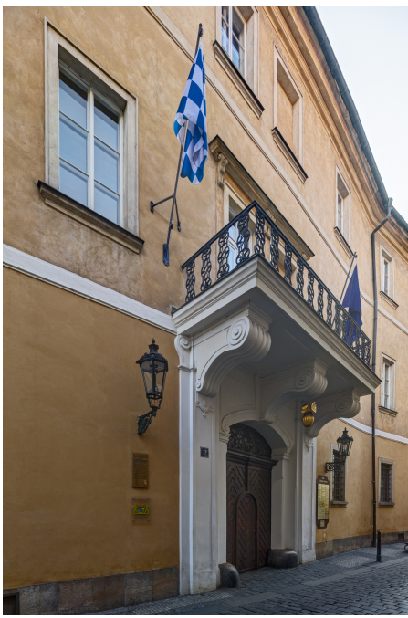
Bayerns Haus in Prag: Palais Chotek.

Beide Gebäudeteile wurden im Laufe der Jahrhunderte mehrmals umgebaut. Die umfangreichsten Umbauten wurden Anfang des 18. Jahrhunderts vorgenommen, als die Objekte in den Besitz der altböhmischen Adelsfamilie Chotek gelangten. Johann Nepomuk Rudolf Graf von Chotek (1748–1824) und nach ihm vor allem sein Sohn Karel Graf von Chotek (1783–1862), ließen die beiden Häuser zu einem großen Gebäude zusammenfügen. So entstand das heutige Palais mit einer einheitlichen Fassade. Ebenfalls im 18. Jahrhundert entstand der monumentale Treppenaufgang, der heute zu den Repräsentationsräumen der Repräsentanz führt.