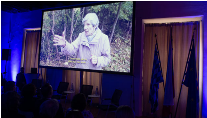
„Das Licht für die Zukunft / Světlo pro budoucnost“: Filmpremiere ...