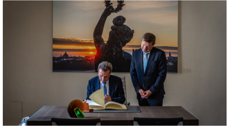
Besuch des ehemaligen Ministerpräsidenten von Baden-Württemberg ...