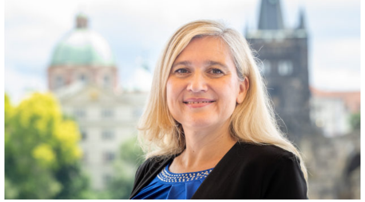
Europaministerin Huml in Prag