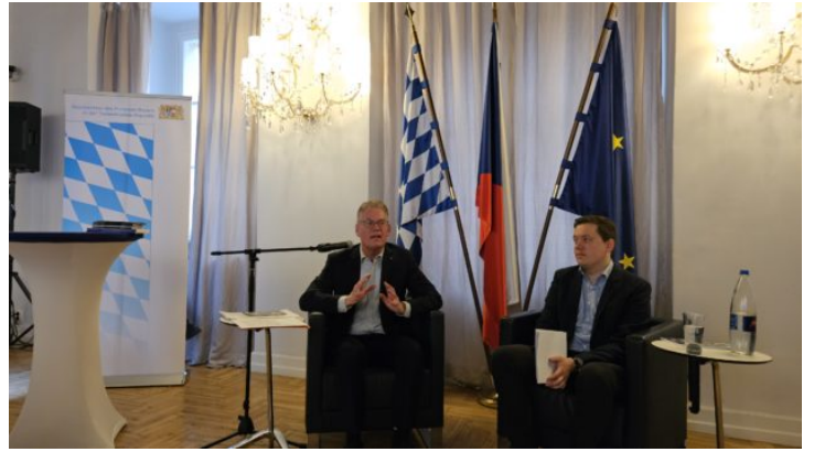
Literarischer Abend zum Prager Kreis und Johannes Urzidil