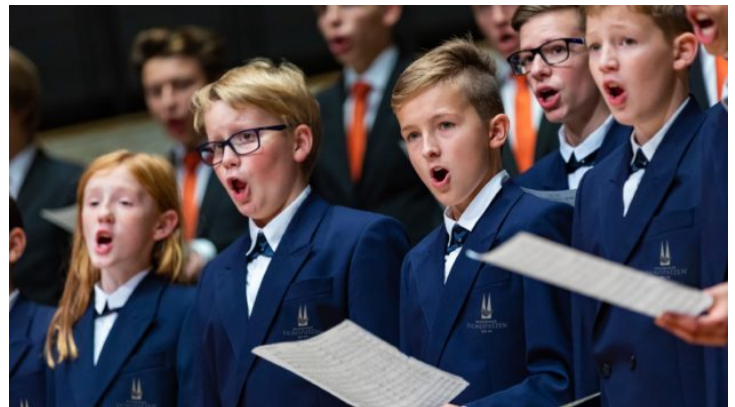
Regensburger Domspatzen in Tschechien – 10 Jahre Repräsentanz ...