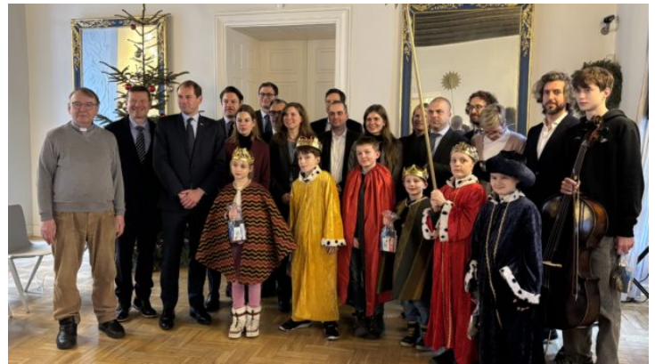
Sternsinger in der Repräsentanz