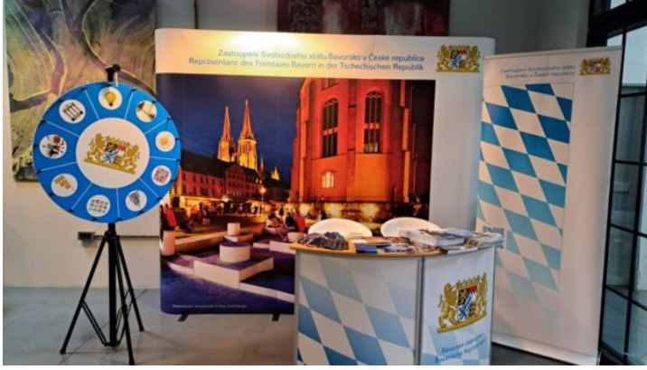
Treffpunkt-Festival in Pilsen