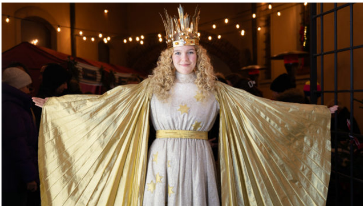
Glückliche Gesichter auf dem 2. Bayerisch-Böhmischen Adventsmarkt ...