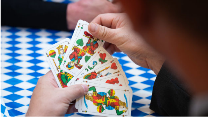
Bayerischer Abend mit „Schafkopf für alle“