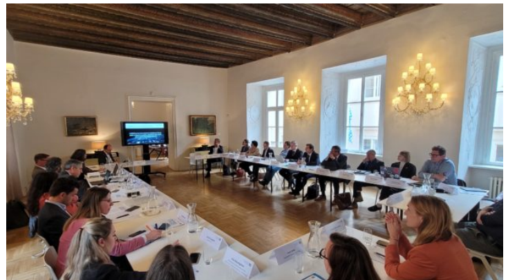
Fachaustausch mit der EUSPA