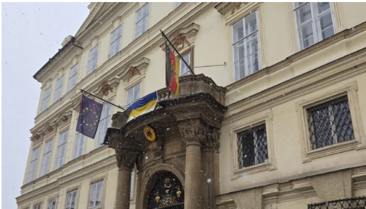
Bayerische Beamte zur Fortbildung in der Tschechischen Republik ...