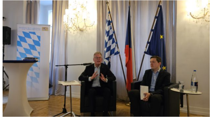
Literarischer Abend zum Prager Kreis und Johannes Urzidil