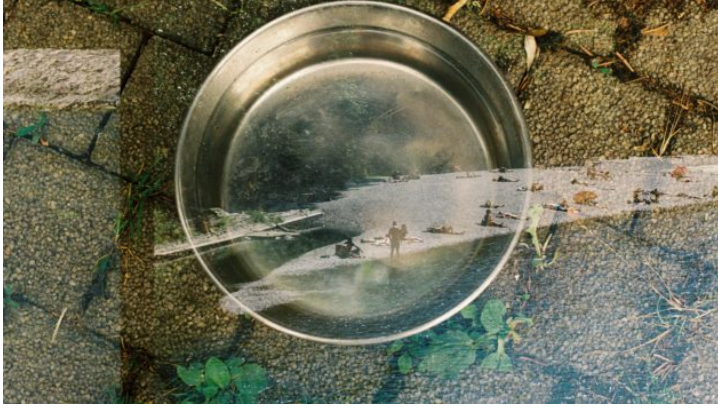
„Auf den zweiten Blick | Na druhý pohled“ Ein Fotoaustausch ...