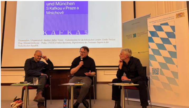
Mit Kafka in Prag und München