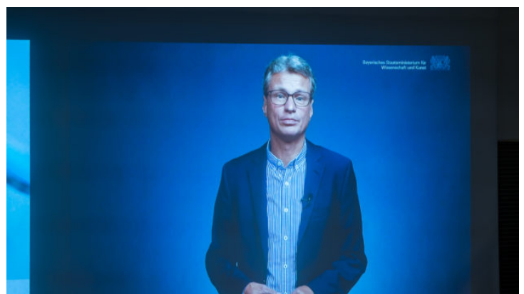
„Pathways into a Sustainable Future“: Konferenz zu grünen ...