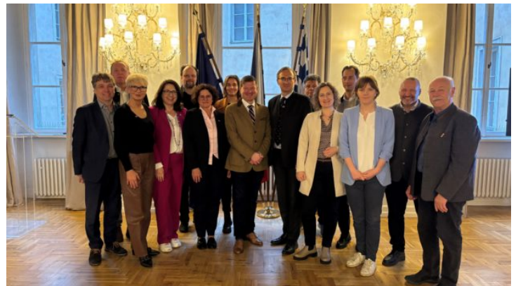
Ausschuss für Umwelt- und Verbraucherschutz des Bayerischen ...