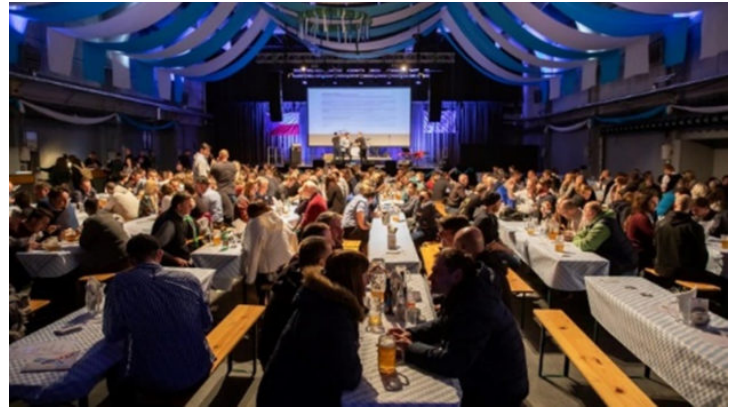
Bayerisch-böhmische Kultur | Kreativ | Tage in Pilsen