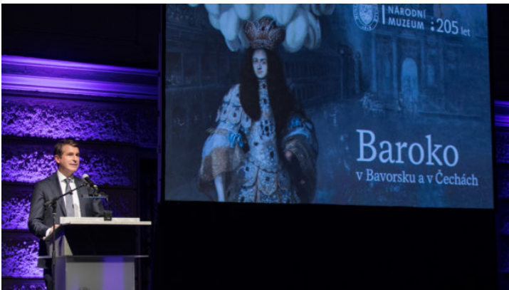
Eröffnung der bayerisch-tschechischen Landesausstellung in ...