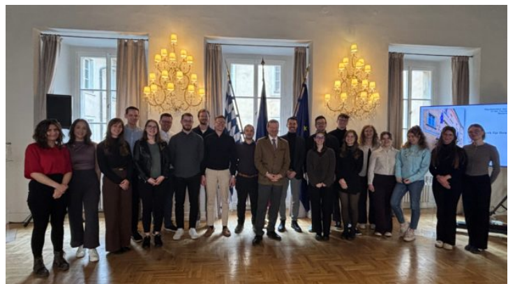
Besuch von Referendaren des Landgerichts Bamberg