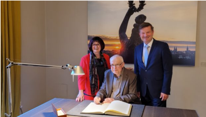
Vernissage der Ausstellung „Böhmen liegt nicht am Meer - ...