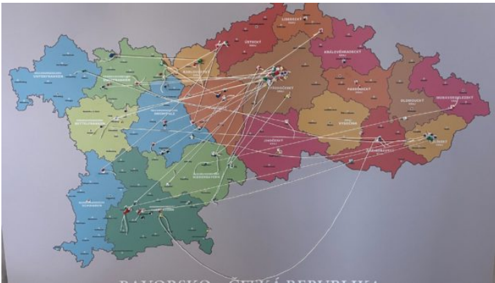
Zweites bayerisch-tschechisches Lehrer-Netzwerktreffen