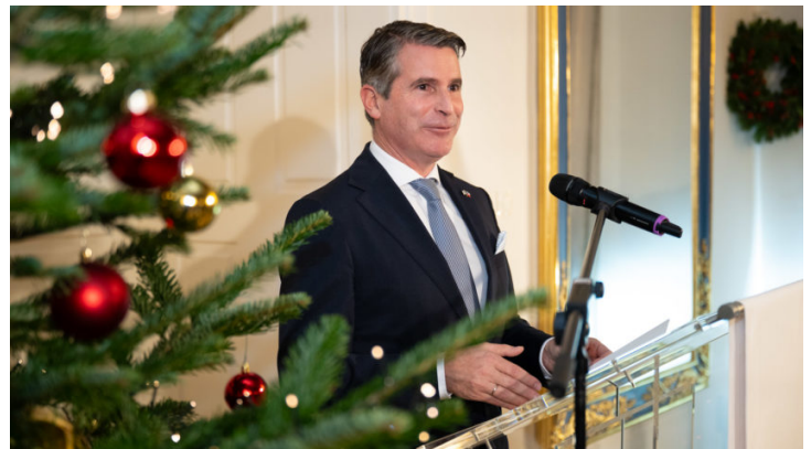
Abend im Advent 2025