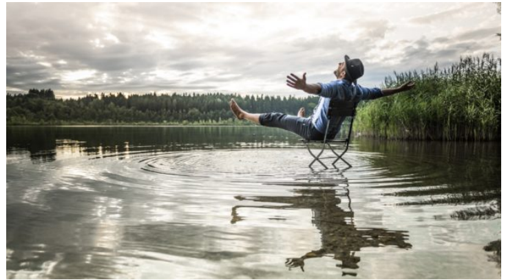
Bayern siebenmal anders: Batterien aufladen