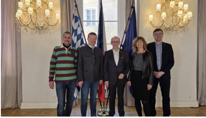
Auswahltagung für das Bayerische Parlamentspraktikum (BayPP) ...