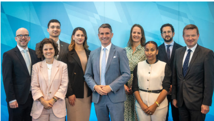
Die Leiterinnen und Leiter der Repräsentanzen des Freistaates ...