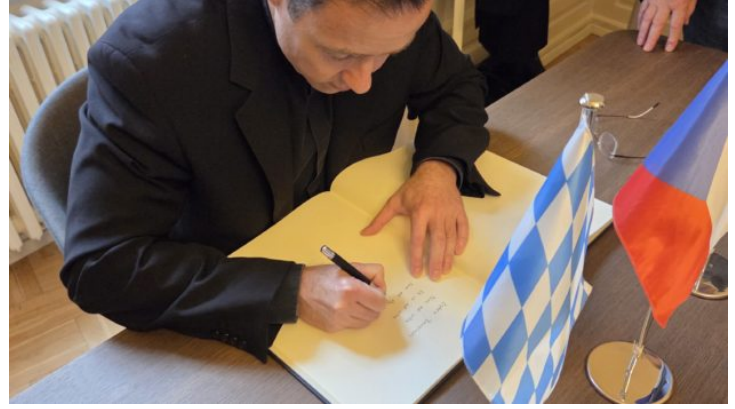
Priesterseminar St. Johannes der Täufer der Erzdiözese München ...