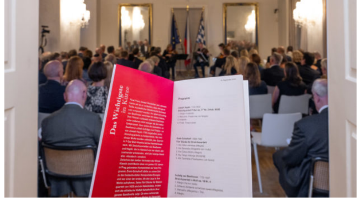
Konzert des Berganza-Quartetts der Bamberger Symphoniker in ...