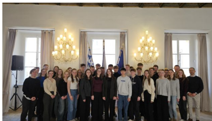
Prag erleben: Schüler des Augustinus- Gymnasium Weiden blicken ...