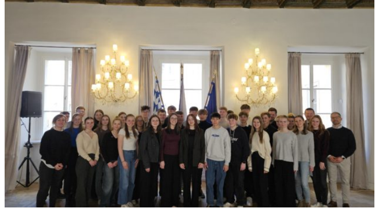
Prag erleben: Schüler des Augustinus-Gymnasium Weiden blicken ...