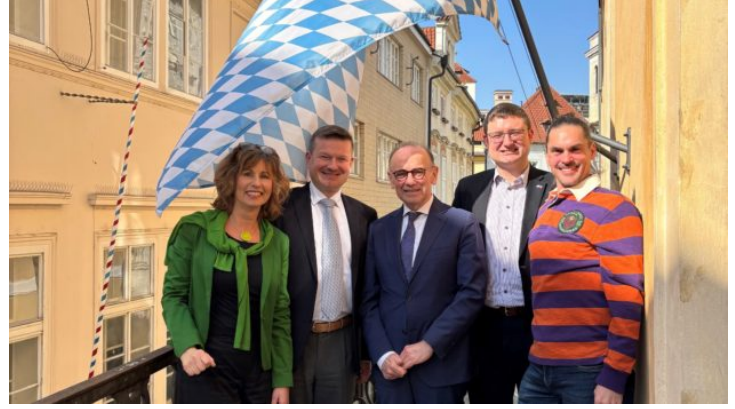
Auswahlgespräch für das Bayerische Parlamentspraktikum (BayPP) ...