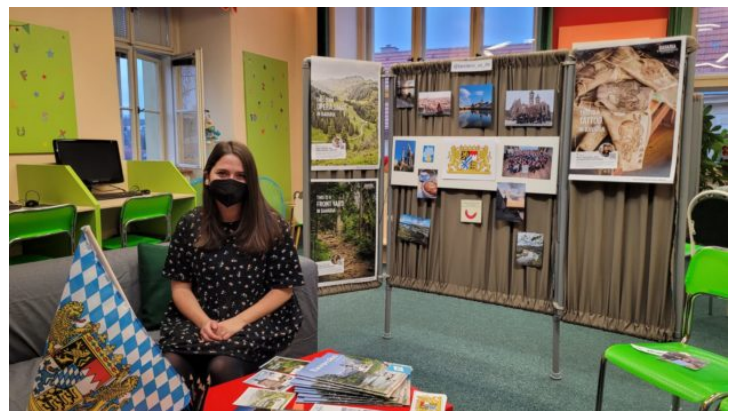
Lebendige Bibliothek für Schüler in Slaný (Schlan)