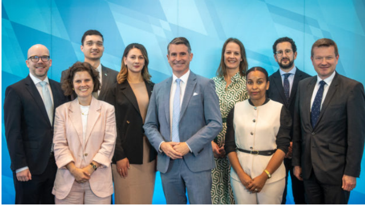
Die Leiterinnen und Leiter der Repräsentanzen des Freistaates ...