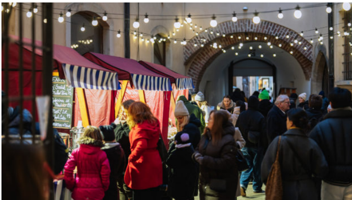
Adventsmarkt anlässlich 10 Jahre Bayerische Repräsentanz in ...