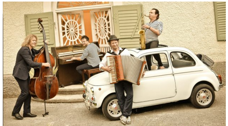
Weltmusik von bayerischer Band Quadro Nuevo – Online-Konzert ...