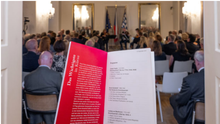
Konzert des Berganza-Quartetts der Bamberger Symphoniker in ...