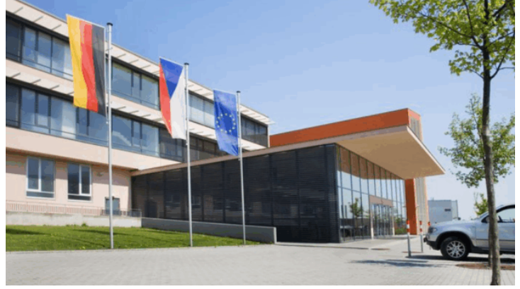
Zeitzeugengespräch an der Deutschen Schule Prag