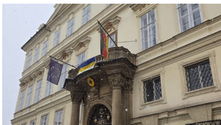
Bayerische Beamte zur Fortbildung in der Tschechischen Republik ...