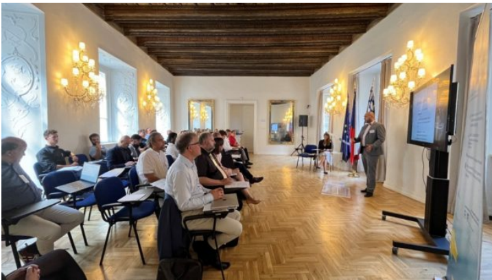
Bavarian-Czech AI and Robotics Workshop