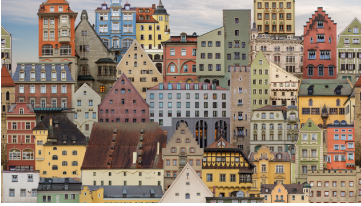
Verwandelte Fotos - Ausstellung der Künstlerin Lena Schabus ...