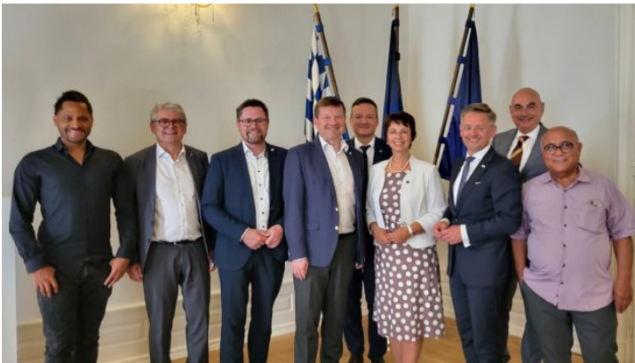
Europausschuss des Bayerischen Landtags zu Besuch in Prag