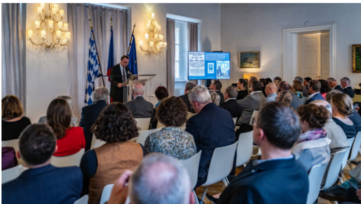
Zweite bayerisch-böhmische Soirée