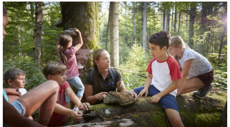
Vom Sofa nach Bayern: Wanderung durch den Nationalpark Bayerischer ...