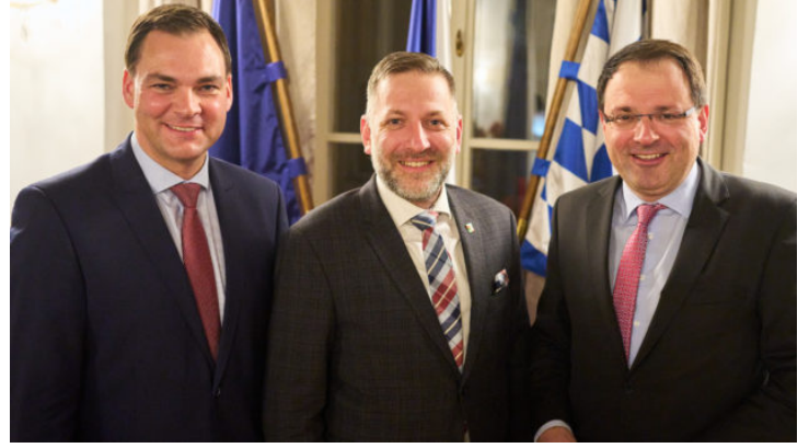
Bayerisch-tschechische Zusammenarbeit in der Grenzregion