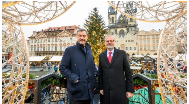
Ministerpräsident Dr. Söder in Prag