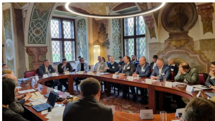
Grenzüberschreitender Dialog zum Thema „Artificial Intelligence ...