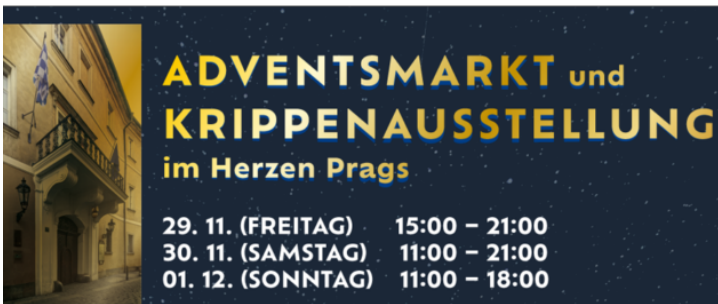
Adventsmarkt und Bayerisch-Böhmische Krippenausstellung