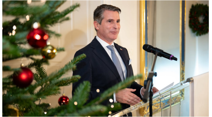
Abend im Advent 2025