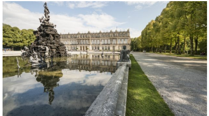
Vom Sofa nach Bayern: Führung durch das Schloss Herrenchiemsee ...