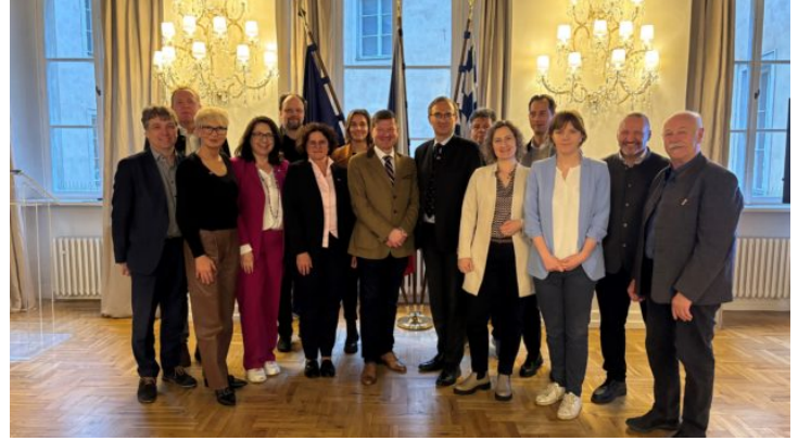
Ausschuss für Umwelt- und Verbraucherschutz des Bayerischen ...