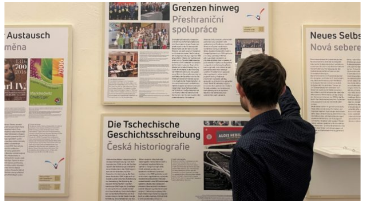
„So geht Verständigung – dorozumění“