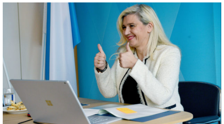
Nachbarsprache im O-Ton