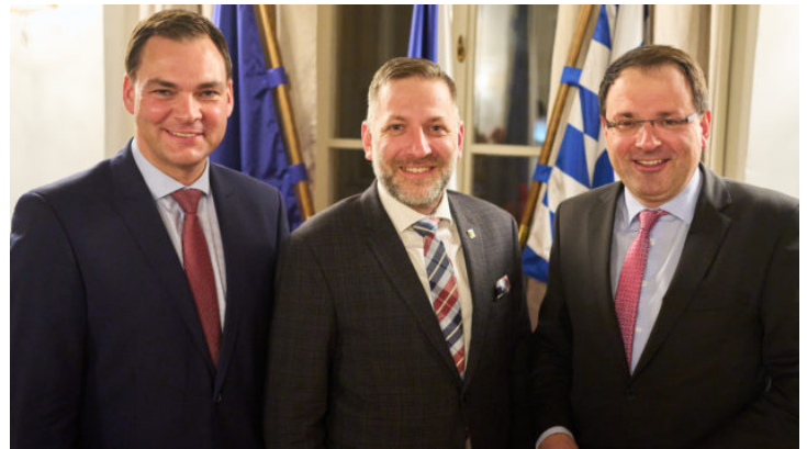
Bayerisch-tschechische Zusammenarbeit in der Grenzregion