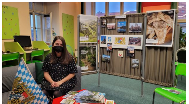
Lebendige Bibliothek für Schüler in Slaný (Schlan)