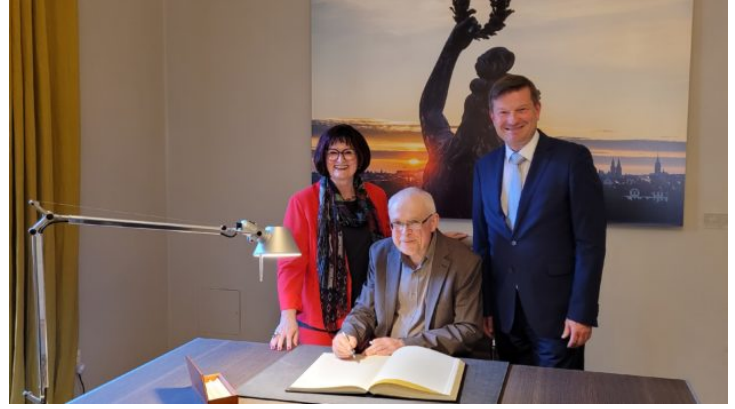
Vernissage der Ausstellung „Böhmen liegt nicht am Meer - ...