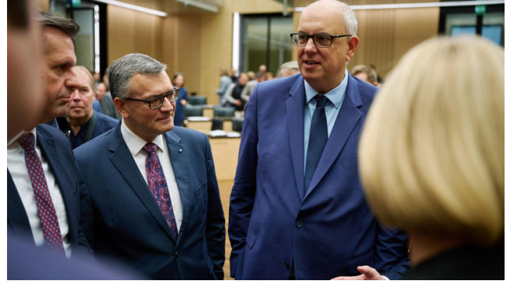
Sitzung des Bundesrates am 17. Oktober 2025