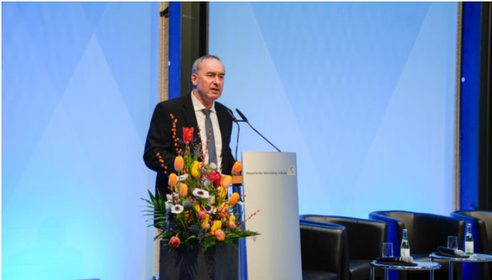
Parlamentarischer Abend zum Thema „Unabhängigkeit der Freien ...