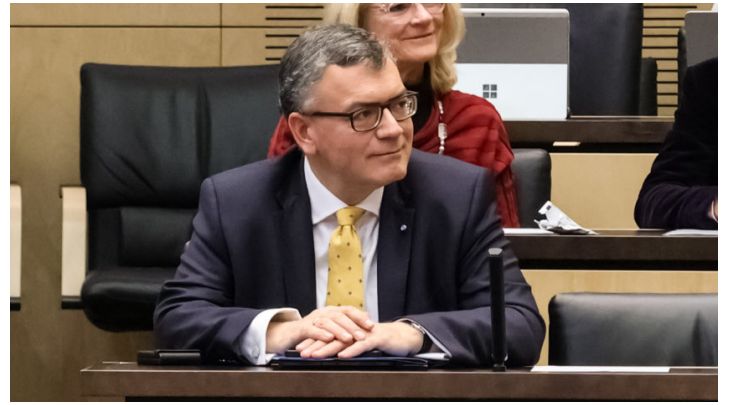
Sitzung des Bundesrates am 7. Dezember 2023

Nachtragshaushalt 2023 / Bayerische Initiativen u.a. Weiterentwicklung Bürgergeld, Schutz der bäuerlichen Rinderhaltung, Schutz der Weidetierhaltung vor wachsender Wolfspopulation, rechtssichere Bezahlkarte für Asylbewerber