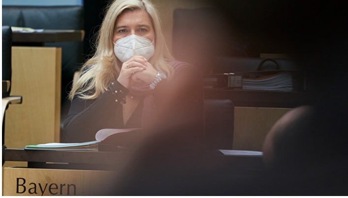
Sitzung des Bundesrates am 28. Mai 2021

Mehr Klimaschutz und Ausbau Ganztagsförderung