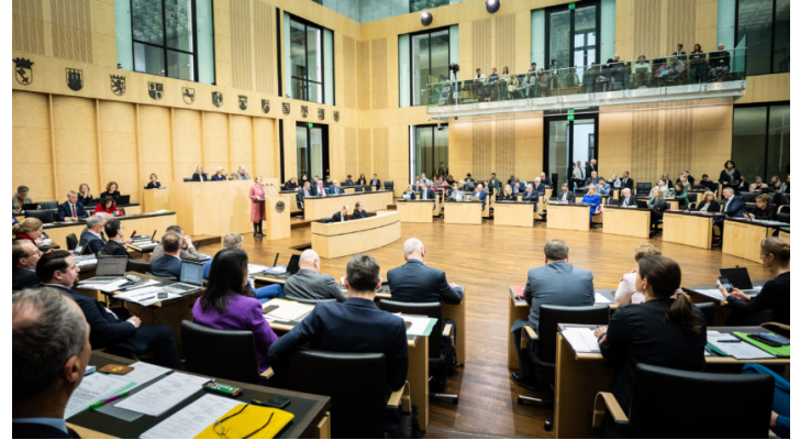
Sitzung des Bundesrates am 14. Februar 2025

Ministerpräsident Dr. Markus Söder: „Historische Entscheidung im Bundesrat: Deutschland ist wieder da.“