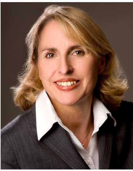
Porträt: Staatsrätin Karolina Gernbauer

An der Spitze der Vertretung steht Staatsrätin Karolina Gernbauer als Bevollmächtigte des Freistaates Bayern beim Bund .