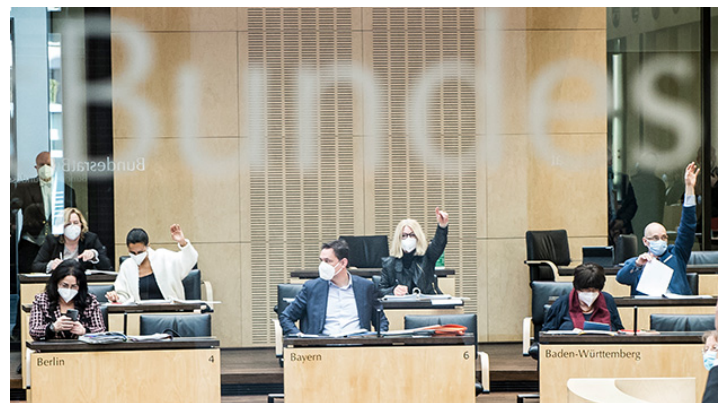
Bundesrat am 5. März 2021