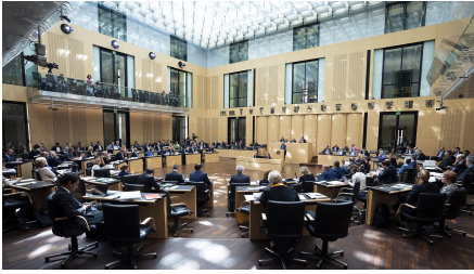
Plenarsitzung des Bundesrates.