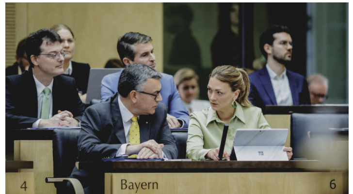
Sitzung des Bundesrates am 22. November 2024