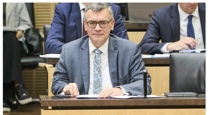
Sitzung des Bundesrates am 11. April 2025