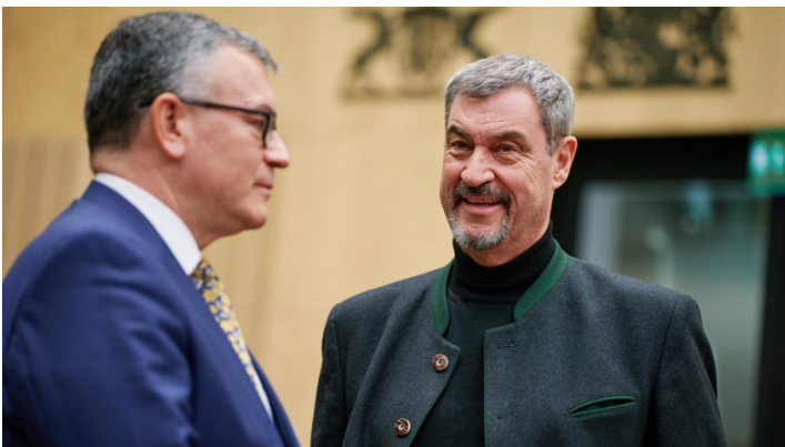
Sitzung des Bundesrates am 19. Dezember 2025