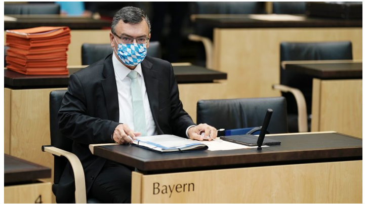
Sitzung des Bundesrates am 18. September 2020