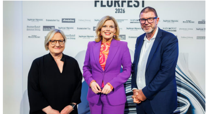
Flurfest der Augsburgener Allgemeinen