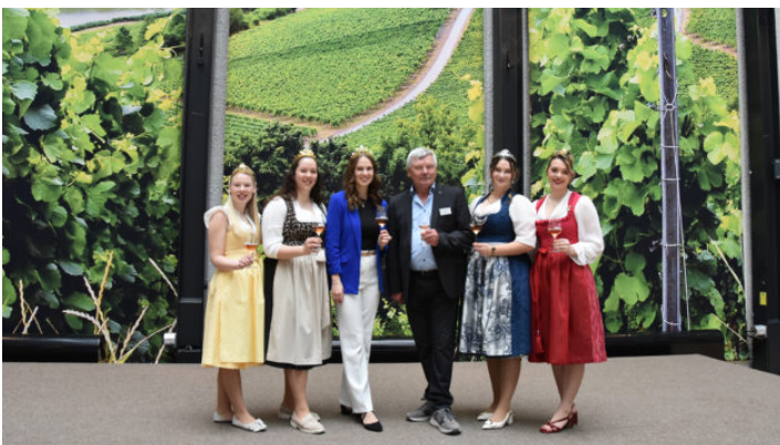
Die Zeit ist reif für Frankenwein / Schlenderweinprobe