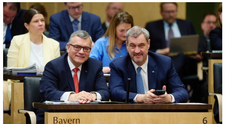
Ministerpräsident Dr. Markus Söder: „Wir sagen hohen Spritpreisen den Kampf an“