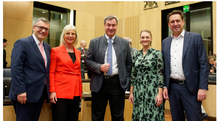
Sitzung des Bundesrates am 24. November 2023

Bayerischer Antrag für dauerhafte Senkung der Gastronomie-Steuer / Wachstumschancengesetz / Kindergrundsicherung / Rückführungsverbesserungsgesetz