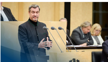
Ministerpräsident Dr. Markus Söder bei einer Rede im Bundesrat.

Ausgehend vom Bundesrat als Länderkammer begleitet die Vertretung schwerpunktmäßig die Gesetzgebung des Bundes. Jedes Bayerische Staatsministerium entsendet eine Verbindungsreferentin bzw. einen Verbindungsreferenten zur Beobachtung der Politikthemen des jeweiligen Ressorts in Berlin.