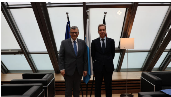
Besuch des Botschafters von Griechenland