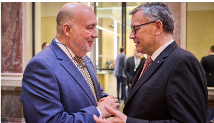
Sitzung des Bundesrates am 6. März 2026

Ministerpräsident Dr. Markus Söder: „Wir sagen hohen Spritpreisen den Kampf an“