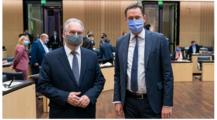
Sitzung des Bundesrates am 9. Oktober 2020

Kampf gegen Corona-Pandemie: Bundesratsminister Dr. Herrmann stellt bayerische Initiative vor