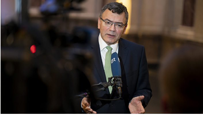
Sitzung des Bundesrates am 6. November 2020

Kampf gegen Corona-Pandemie: Bundesratsminister Dr. Herrmann stellt bayerische Initiative vor