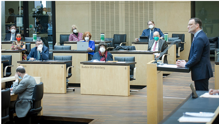
Sondersitzung des Bundesrates am 22. April 2021

Erleichterungen für Geimpfte und Genesene