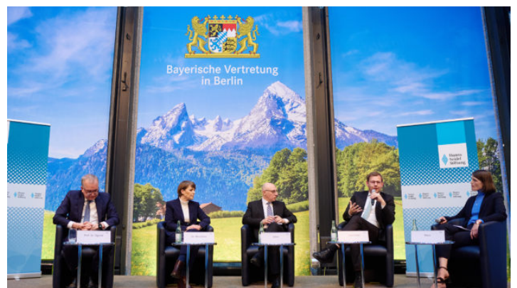
Zwischen Spionage und Sabotage – Sicherheitspolitische Herausforderungen