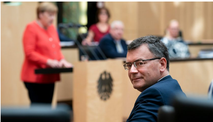
Sitzung des Bundesrates am 3. Juli 2020

Europa, Konjunkturpaket, Kohleausstieg, Grundrente