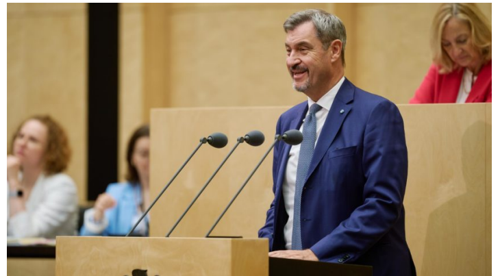
Sitzung des Bundesrates am 11. Juli 2025

Staatsminister Dr. Florian Herrmann: Mit den Stimmen Bayerns haben die Länder den Bundshaushalt für 2025 endgültig verabschiedet.