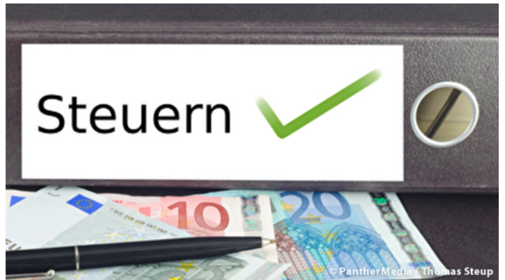
Sitzung des Bundesrates am 29. Juni 2020

Europa, Konjunkturpaket, Kohleausstieg, Grundrente