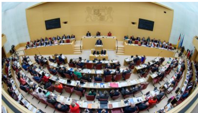
Ministerpräsident Dr. Markus Söder, MdL, im Bayerischen Landtag.

Forschung muss in Europa an erster Stelle stehen. Innovation ist besser als Umverteilung.