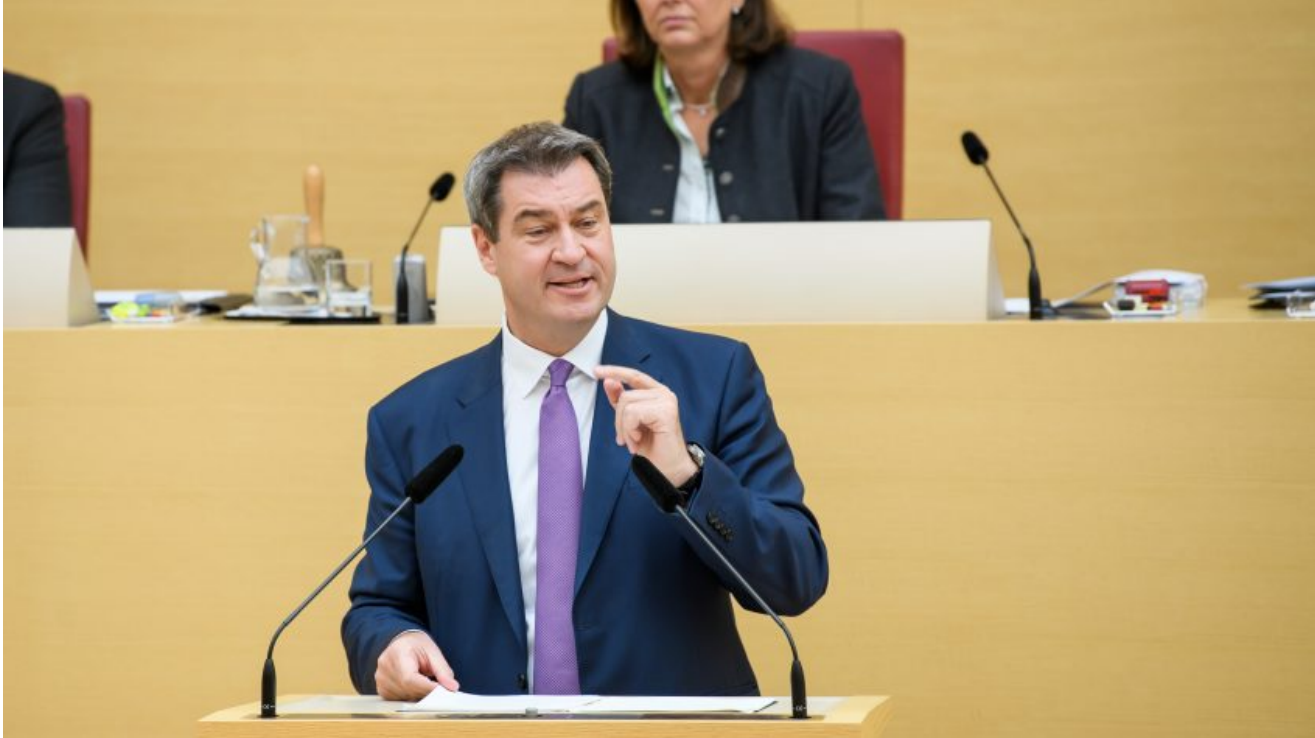
Ministerpräsident Dr. Markus Söder, MdL, hält eine Regierungserklärung am 23. Mai 2019 im Bayerischen Landtag.