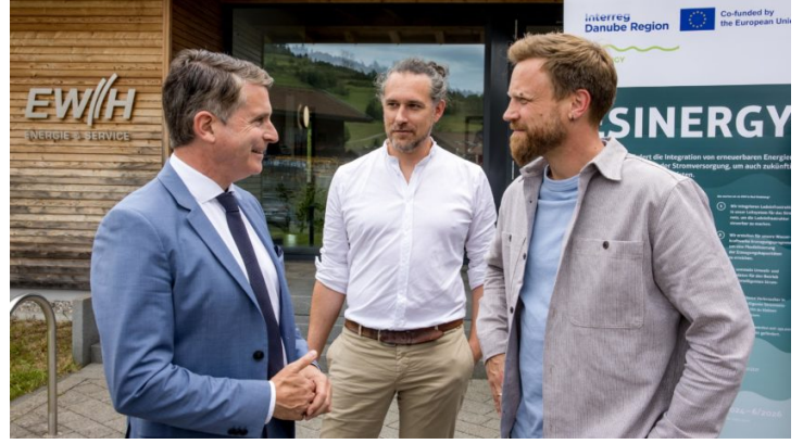
Besuch beim Elektrizitätswerk Hindelang eG