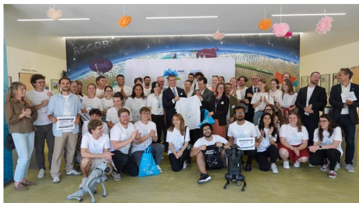
EUSALP AI Hackathon