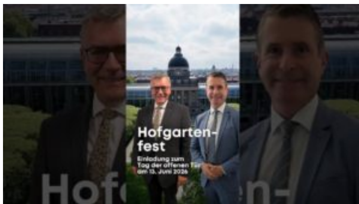
Hofgartenfest und Tag der offenen Tür am 13. Juni 2026 - ...