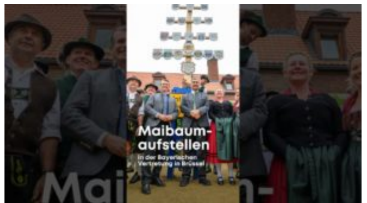
Maibaumaufstellen in der Bayerischen Vertretung in Brüssel ...