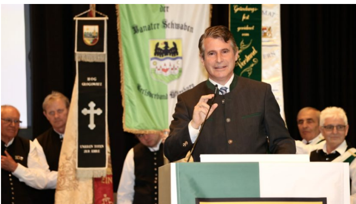
Heimattag der Landsmannschaft der Banater Schwaben