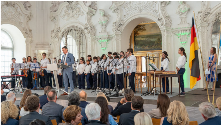
Empfang zum italienischen Nationalfeiertag