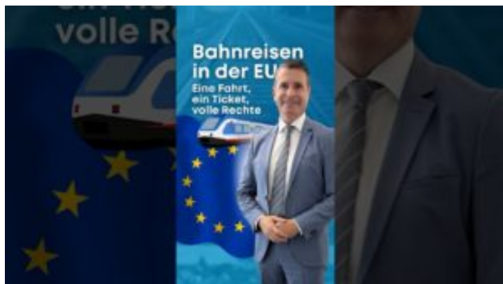
Bahnreisen in der EU- Bayern