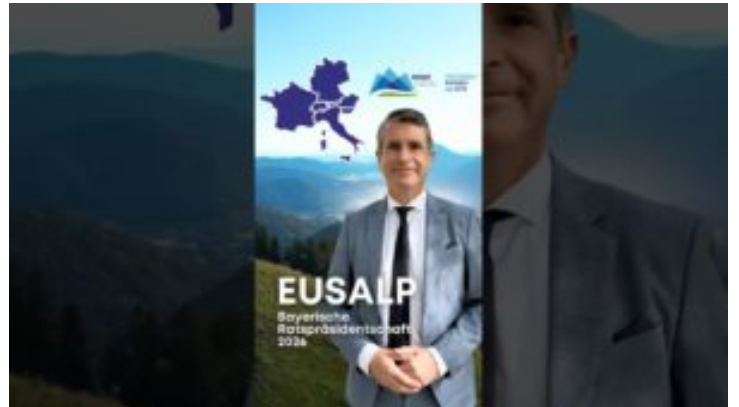
EUSALP – Bayern