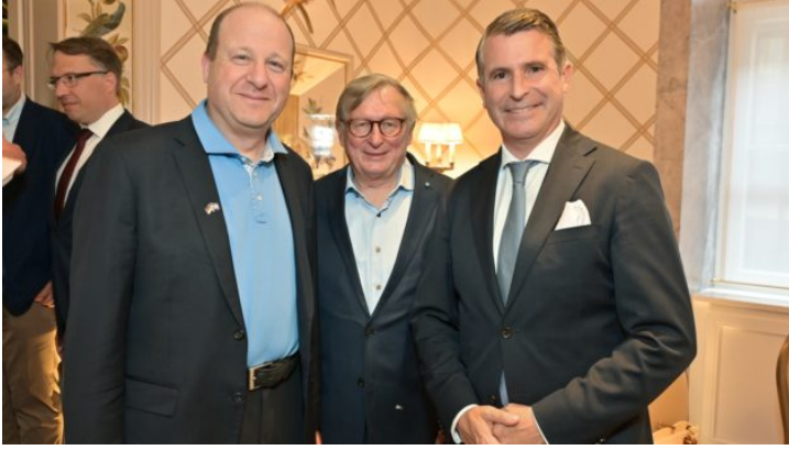
Transatlantic Leaders Dinner des Export-Club Bayern