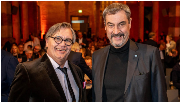
Bayerischer Buchpreis 2025