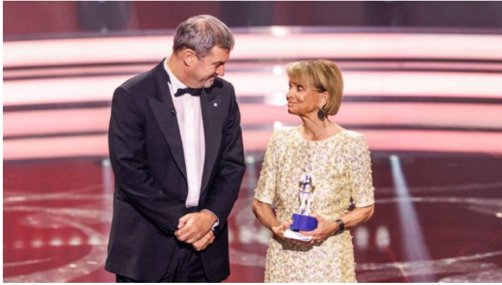
46. Bayerischer Filmpreis