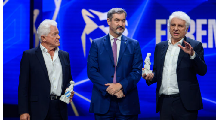
Blauer Panther – TV & Streaming Award 2025