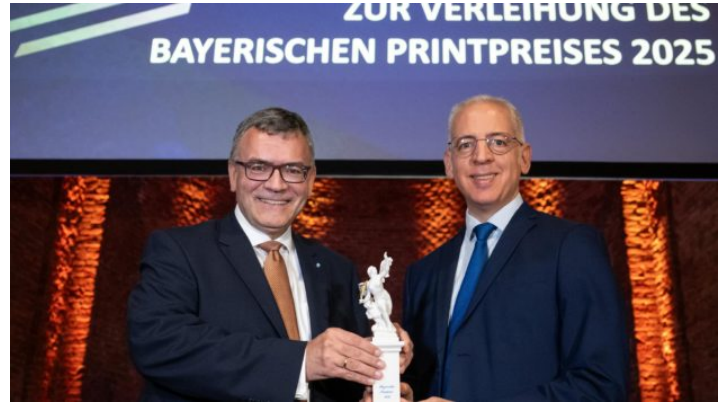
Bayerischer Printpreis 2025