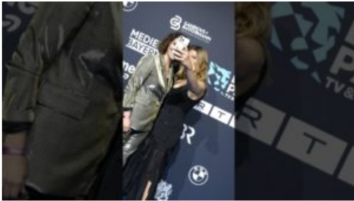
Blauer Panther 2025 – Bayern