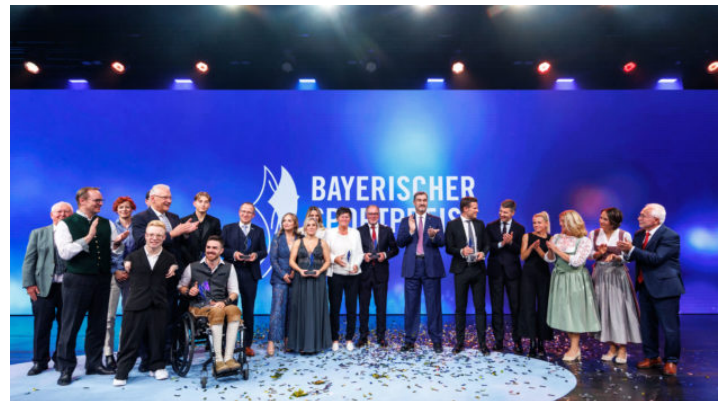
Bayerischer Sportpreis 2025