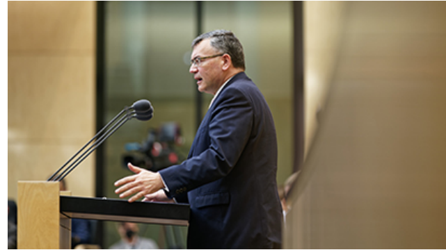
Staatsminister Dr. Florian Herrmann bei seiner Rede bei der 1019. Sitzung im Bundesrat

Die Gesetzentwürfe zur besseren Ausstattung der Bundeswehr werden aus Sicht der Staatsregierung grundsätzlich begrüßt , da Investitionen in Rüstungsvorhaben sicherheitspolitisch dringend geboten sind. Bayerns Bundesratsminister und Leiter der Staatskanzlei Dr. Florian Herrmann mahnte in seiner Rede jedoch wichtige Nachbesserungen an und forderte, die einmalig zur Stärkung der Bündnis- und Verteidigungsfähigkeit vorgesehenen 100 Mrd. EUR ausschließlich für die bislang unzureichende Ausstattung der Bundeswehr einzusetzen und das 2 %-NATO-Ziel dauerhaft einzuhalten.